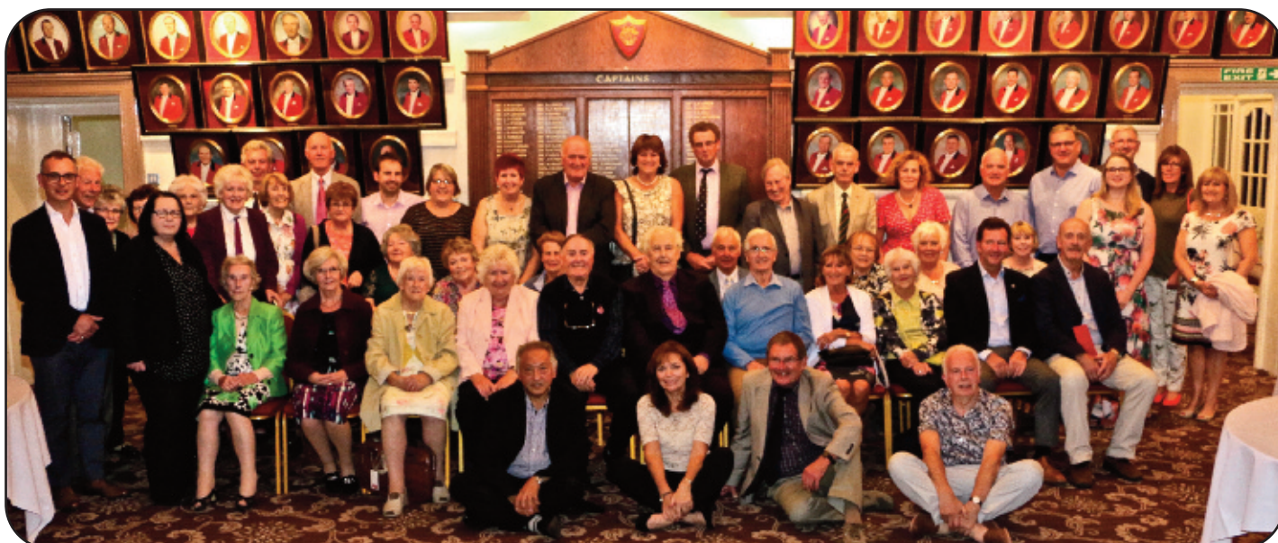
Y Golffwyr a'r Gwesteion