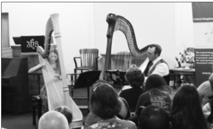
Noson Gerddorol yn Oaker Avenue