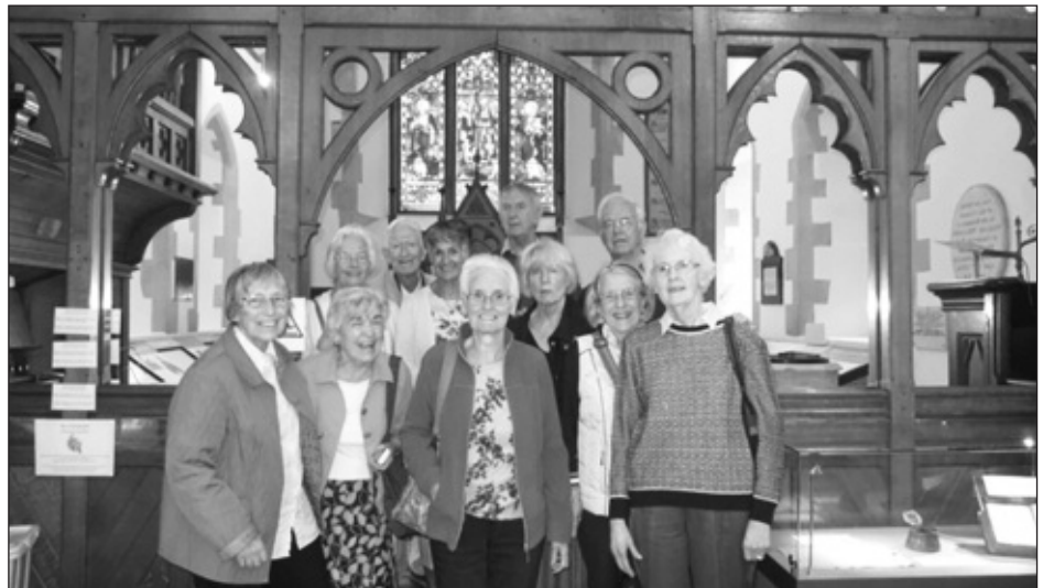
Criw Manceinion yn 'Byd Mary Jones'