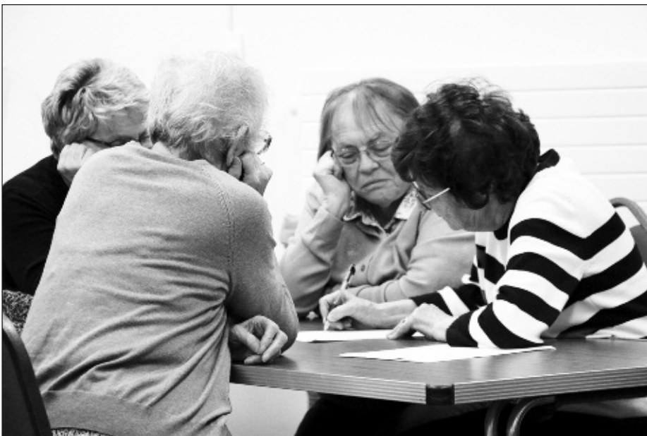
Noson y cwis