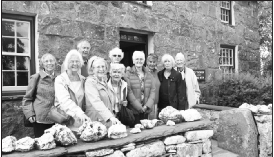
Criw Manceinion yn Yr Ysgwrn