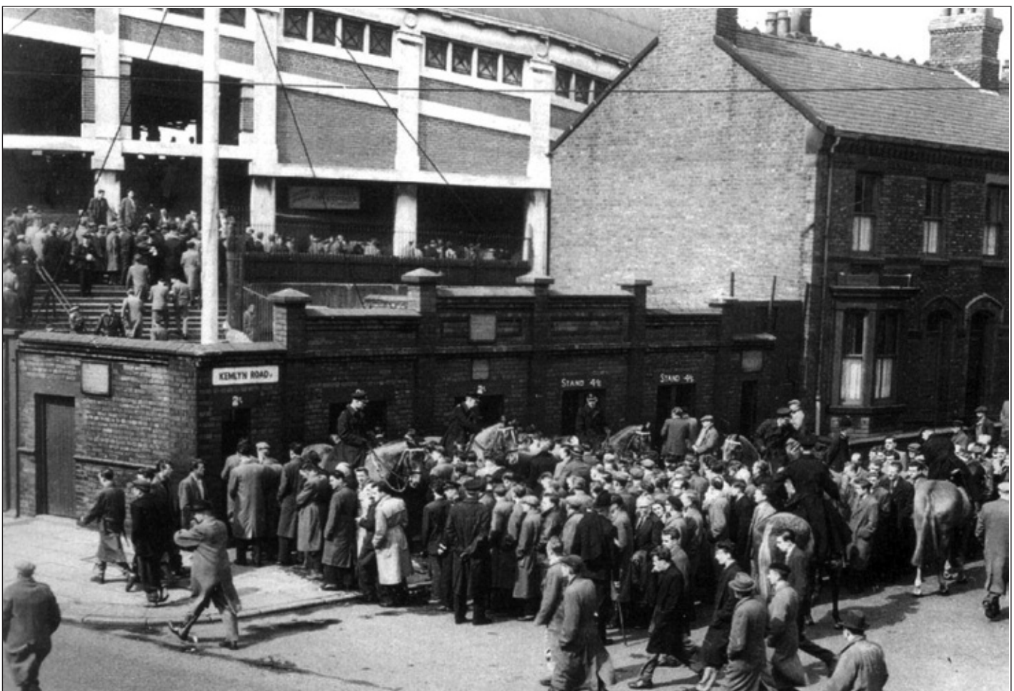
Kemlyn Road, Kop

Pan oedd un athro ar dyletswydd yn yr iard daeth geneth ato a chynnig rhyw fisgedi siocled oedd ganddi. Gwrthododd yr athro ond 'roedd yr eneth yn mynnu gan ddweud bod ganddi fwy na digon gan bod ei chwaer yn dod â hwy gartref o'r ffatri yn ei dillad isaf!