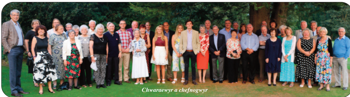
Chwaraewyr a chefnogwyr