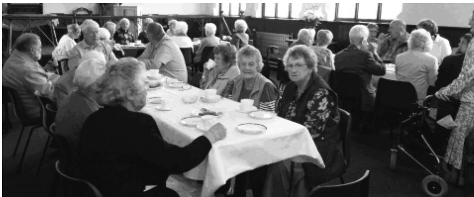
Y Pererinion o Ddyffryn Clwyd