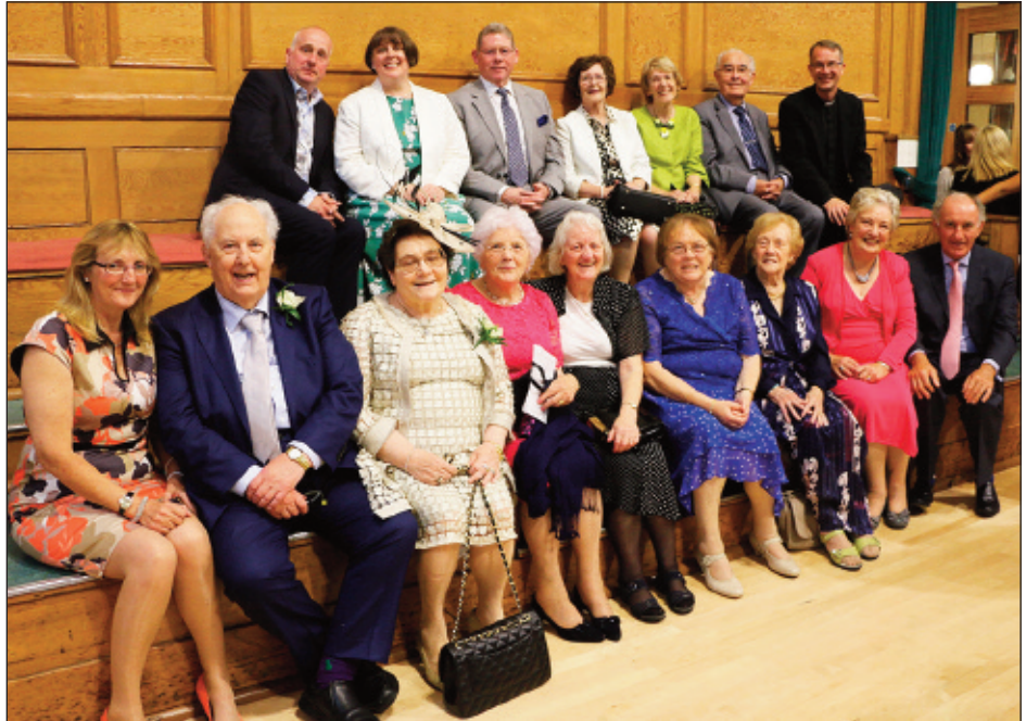
Cymry Lerpwl a'i ffrindiau yn y wledd