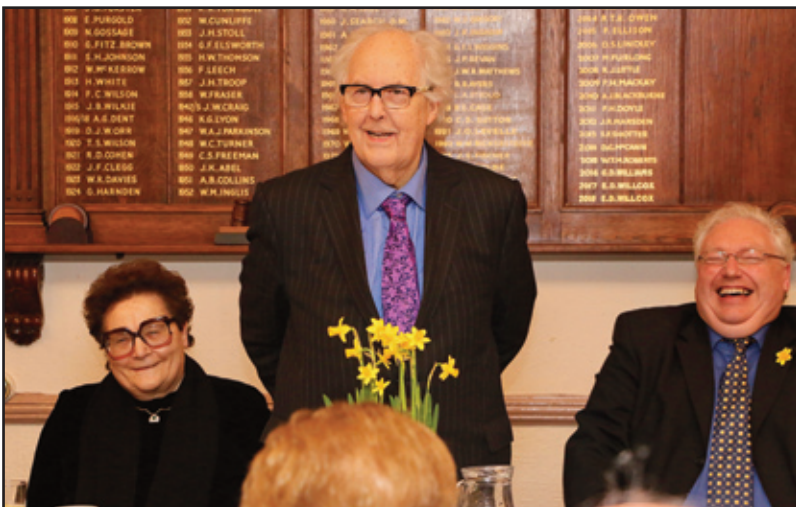
Y Cadeirydd yn gwneud y Gŵr Gwadd ac eraill i wenu