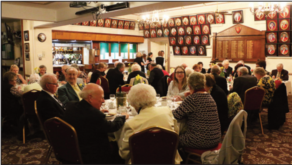
Cinio Gŵyl Dewi