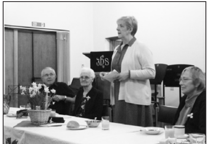
Araith y wraig wadd

• Noson yr Aelwyd : Ar nos Sadwrn Mawrth y 9fed, roedd y capel dan ei sang i gefnogi côr yr efrydwyr Cymraeg sydd wedi sefydlu Aelwyd Manceinion eleni. Maent yn bwriadu cystadlu yn Eisteddfod yr Urdd ac roedden nhw wedi gofyn i drefnu cyngerdd yng nghapel Noddfa Oaker Avenue ar gyfer ymarfer eu caneuon yn gyhoeddus a chasglu arian i logi bws i fynd i Gaerdydd os yn llwyddiannus yn y 'prelims*!' Roedd yn noson fendigedig eto, llawn o dalent a hwyl a theuluoedd y bobl ifainc,