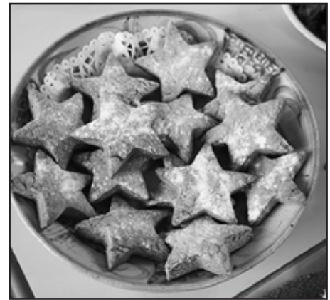
Bisgedi traddodiadol Slovenia