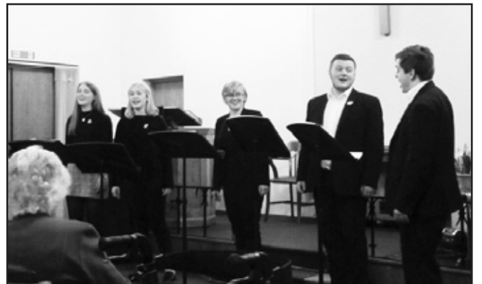
Pump o gantorion dawnus o'r Coleg Cerdd