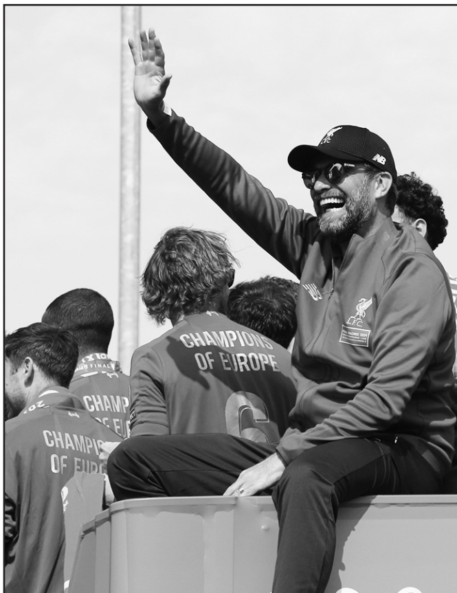
Jürgen Klopp – rheolwr tîm Lerpwl

Credaf yn bersonol fod y fuddugoliaeth ym Madrid yn mynd i esgor ar gyfnod llwyddiannus i Lerpwl. Bu Klopp yn ofalus o'r clwb ers pan iddo ymuno, a bellach y mae ganddo dîm sydd bron cystal â dinas Manceinion (Manchester City). Hwy yw'r pencampwyr na fu mo'i tebyg ers oes aur Lerpwl. Mae'n argoeli bod yr oes aur honno ar y gorwel.