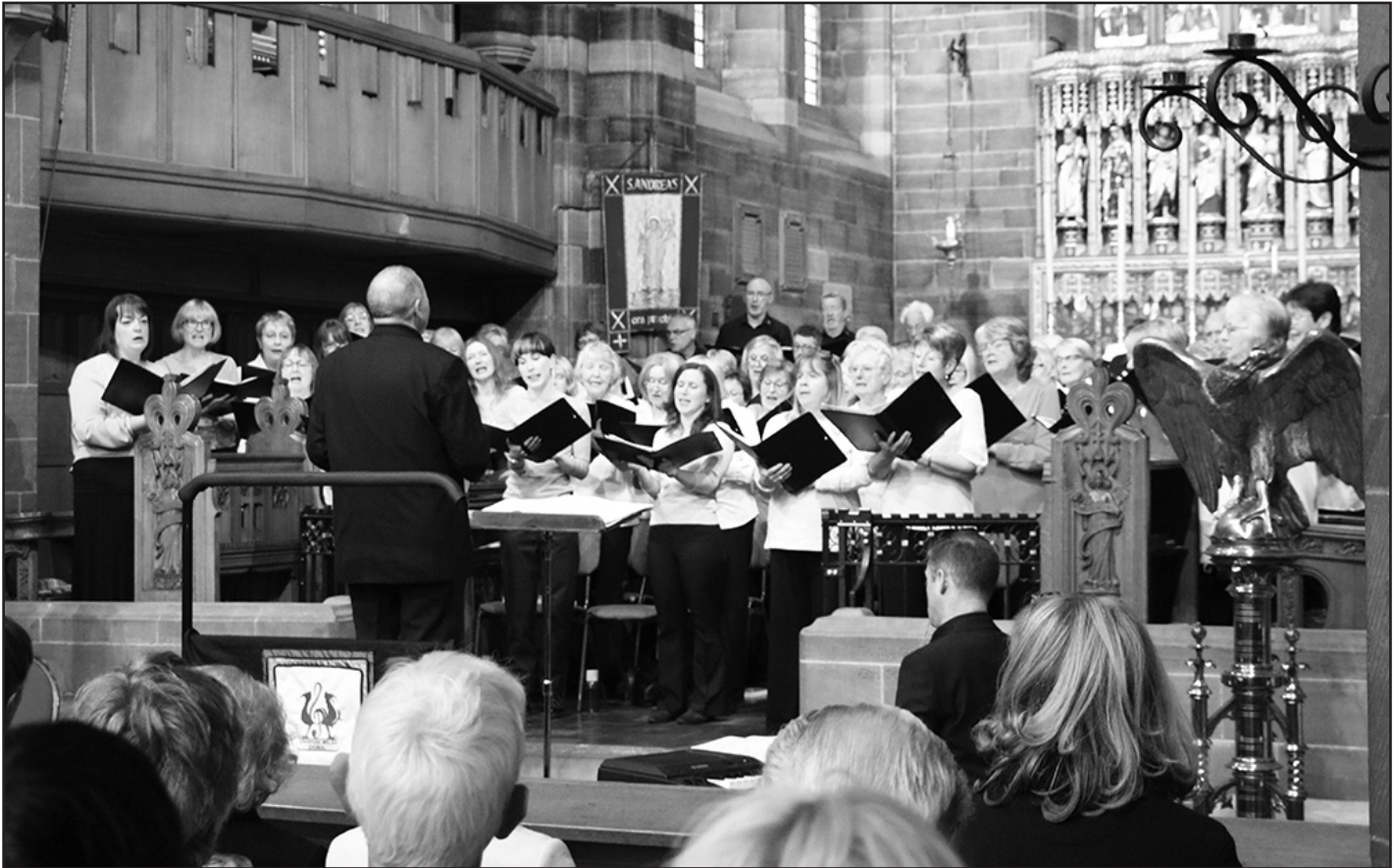
Côr yn canu yn Eglwys St. Andreas