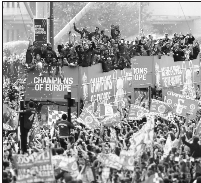
Yr orymdaith yn ninas Lerpwl

Ond yr oedd un elfen arall i'w gofio, cefnogwyr Lerpwl a hwythau adref yn Anfield. Clywsom y miloedd yn canu, yn cefnogi ar gân, yn ysbrydoli pob un o chwaraewyr Lerpwl i fod yn hyf a hyderus. Yn y rhan gyntaf o'r gêm daeth newydd dda pan agoriodd Divock Origi gôl. Lerpwl 1, Barcelona 0 ond mewn gwirionedd 1-3! Yn yr ail hanner cawsom ein cyffroi yn wirioneddol. Marciau llawn i Klopp am ddod ymlaen i chwarae Georginio Wijnaldum. Bu yn cicio'i sodlau yn y rhan gyntaf ond yn awr yr oedd ar y cae. Ac o fewn ychydig funudau gwnaeth Georginio yr amhosibl, sgorio dwy gôl. Yna yn yr wythdeg munud sgoriodd Origi gôl arall. Y sgowser Trent Alexander-Arnold oedd y tu ôl i'r gôl. Ciciodd ef y bêl o'r cornel gan roddi cyfle gwych i Origi. Manteisiodd ar ddiffyg amddifyniad Barcelona. Ni allai gorau'r byd, Lionel Messi a'i gyd chwaraewyr o Barcelona wneud dim byd ond rhyfeddu ar weithred anhygoel tîm pêl-droed Lerpwl. Yr oedd