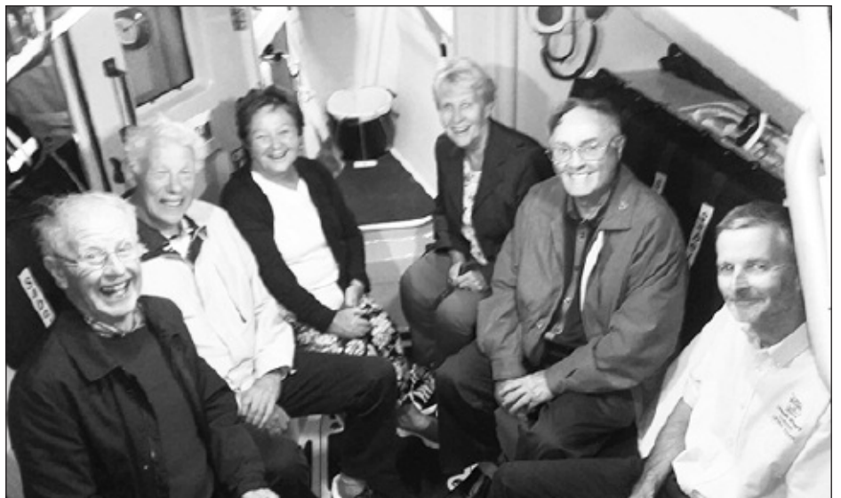
Rhai o'r criw yn y caban achub ar ôl cael eu hachub.

Mae aelodau Cymdeithas Cymru Lerpwl bellach yn edrych ymlaen am gael