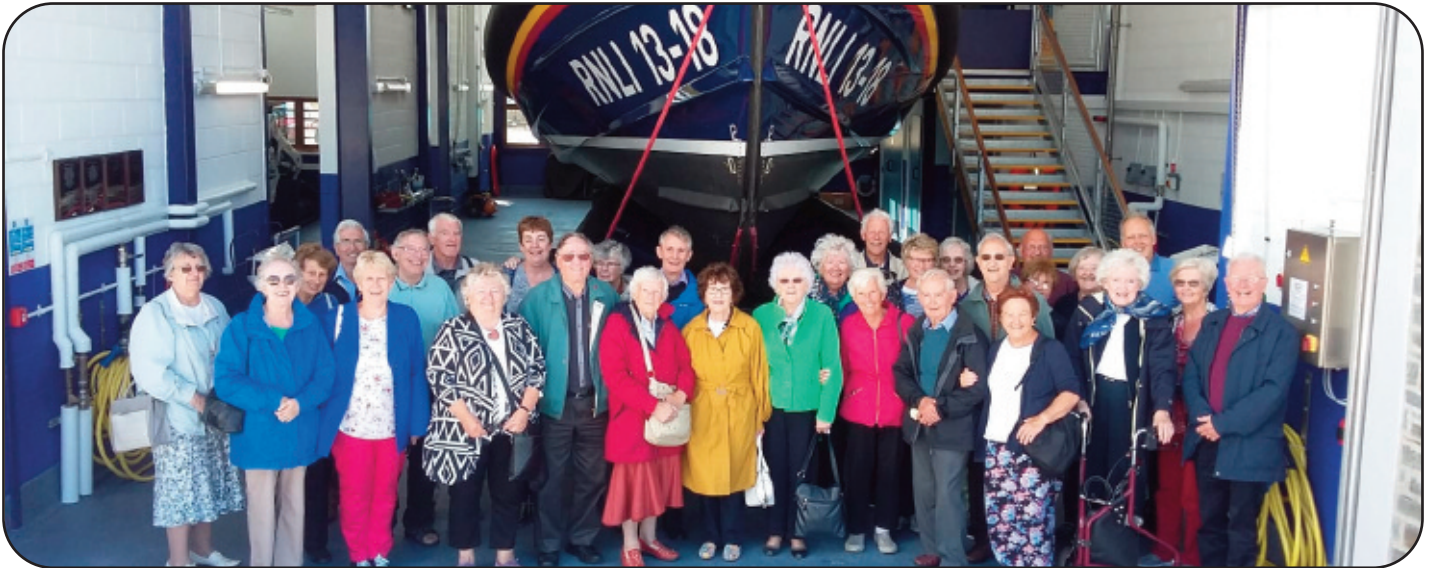
Gwibaith Cymdeithas Cymry Lerpwl i Landudno Ceir eu hanes a mwy o luniau ar dudalen 4 a 5.