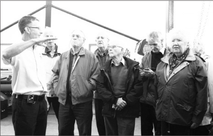
Alun yn egluro

gwibdaith flynyddol wedi cael ei threfnu gan eu hysgrifennydd Norma Owen. Llynedd yr oedd y wibdaith i'r Ysgwrn Trawsfynydd yn llwyddiant mawr er nad oedd y tywydd yn ffafriol. Eleni penderfynwyd mai Llandudno fyddai'r man delfrydol i fynd a hynny am reswm arbennig.