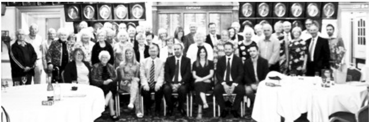
(Lluniau o ginio 2017)

18 twll a chinio £35. Cinio yn unig £20. Raffl ac ocsiwn wedi'r cinio.