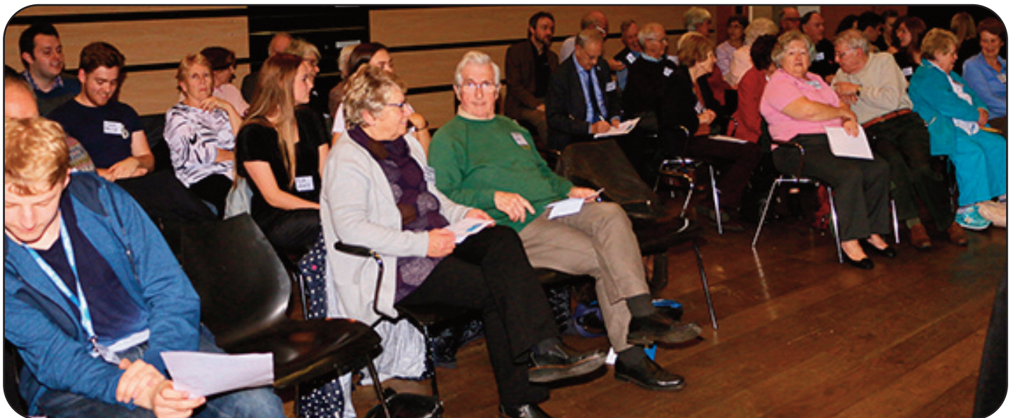
Y gynulleidfa hardd yn Hawl i Holi