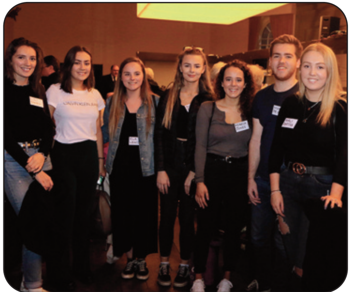
Rhai o'r myfyrwyr oedd yn bresennol