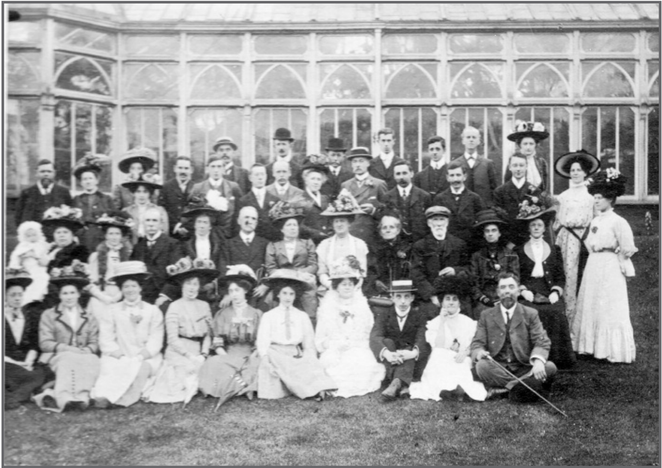
Picnic Cymdeithas 'Young Wales' Mai 1909 yn Churchtown, Southport