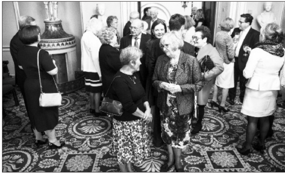
Rhai o'r gwahoddedigion a ddaeth ynghyd i'r cyfarfod dinesig