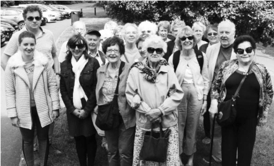
Y Cerddwyr a'r Cefnogwyr