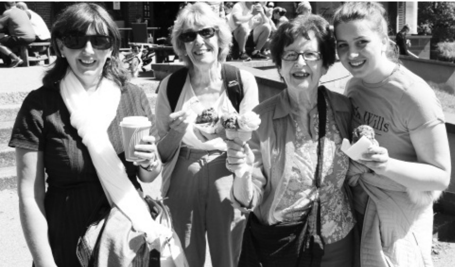
Ar ddiwedd y daith, ymlacio

Dros y blynyddoedd mae nifer o weithgareddau Cymry Lerpwl wedi bod yn gysylltiedig â Pharc Sefton e.e. Eisteddfod Genedlaethol 1929. Daeth nifer o aelodau Eglwys Bethel i gymeryd rhan mewn taith gerdded nodedig o amgylch y Parc er mwyn codi arian i Apêl Corwynt Cariad a hynny ar fore Sadwrn, 8 Gorffennaf. Daeth nifer yna i ddymuno dda i ni am daith hwylus a ddi-anaf. Fe wnaed elw o £1151 oherwydd haelioni yr aelodau, eu teuluoedd a phobl caredig Lerpwl. Dyma wyrth go iawn.