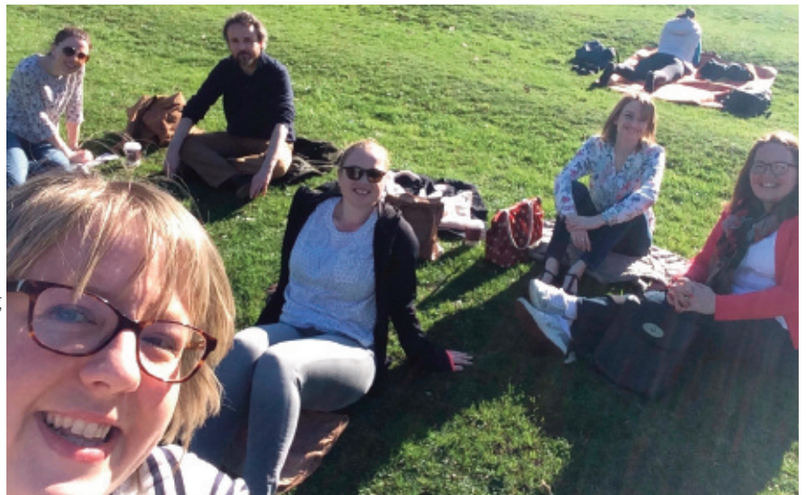
WPS! Yn ymlacio ym Mharc Sefton yn yr haf