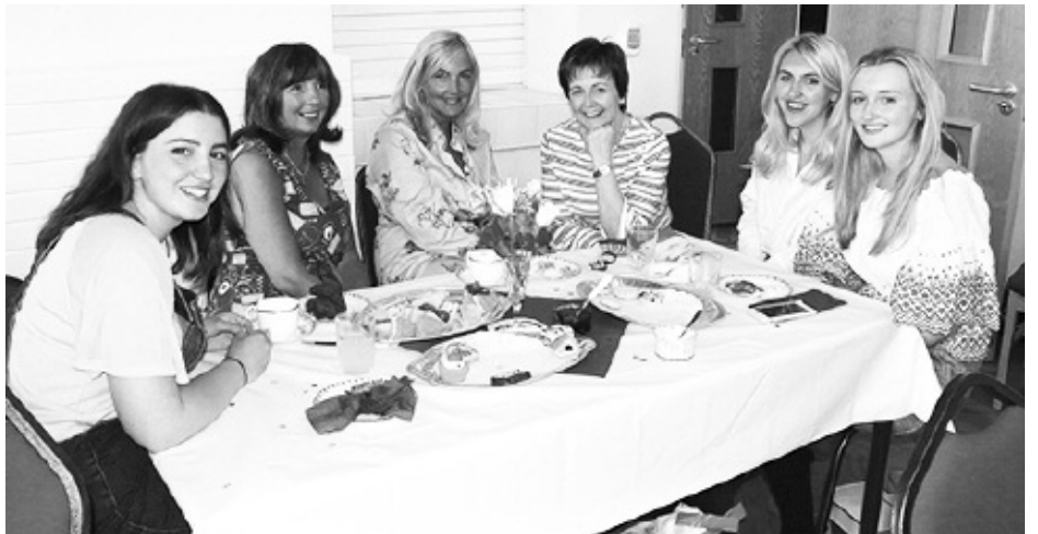
Bwrdd yr Ifanc