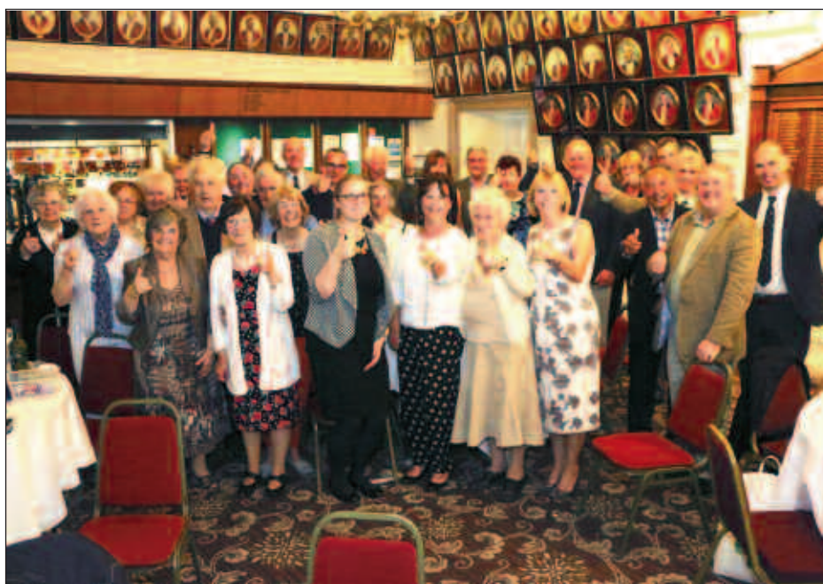
Ygolffwyr a'r gwestion