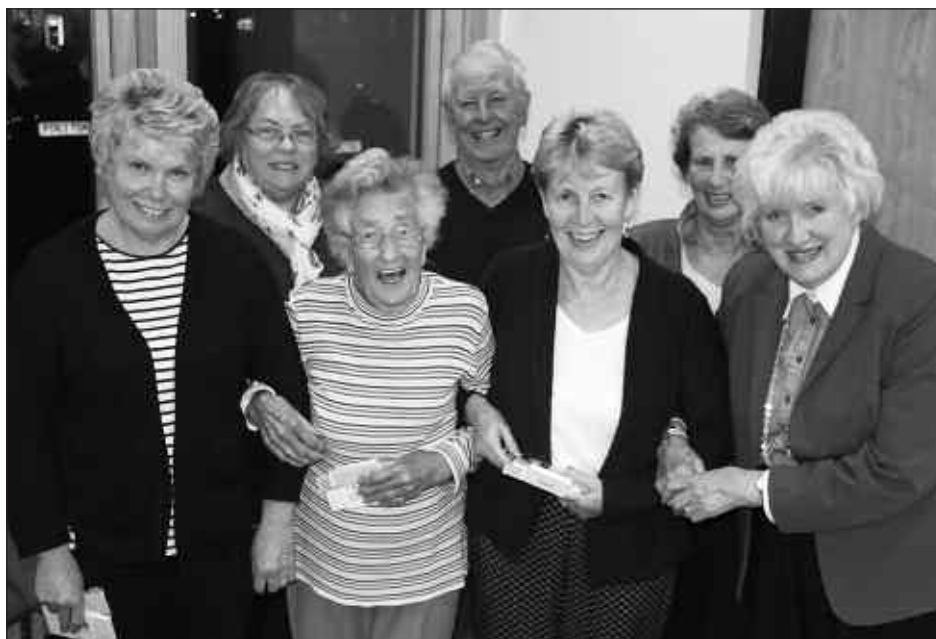
Tîm buddugol y cwis