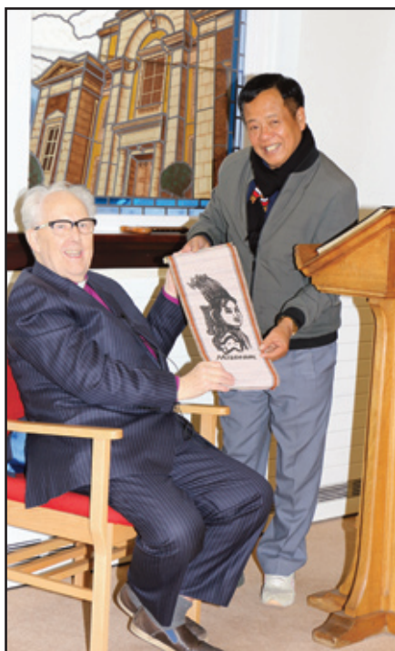
Van Lal Lawma yn cyflwyno'r faner