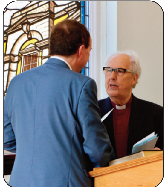
Y Gweinidog yn bendithio ei Gynorthwy-ydd Bugeiliol