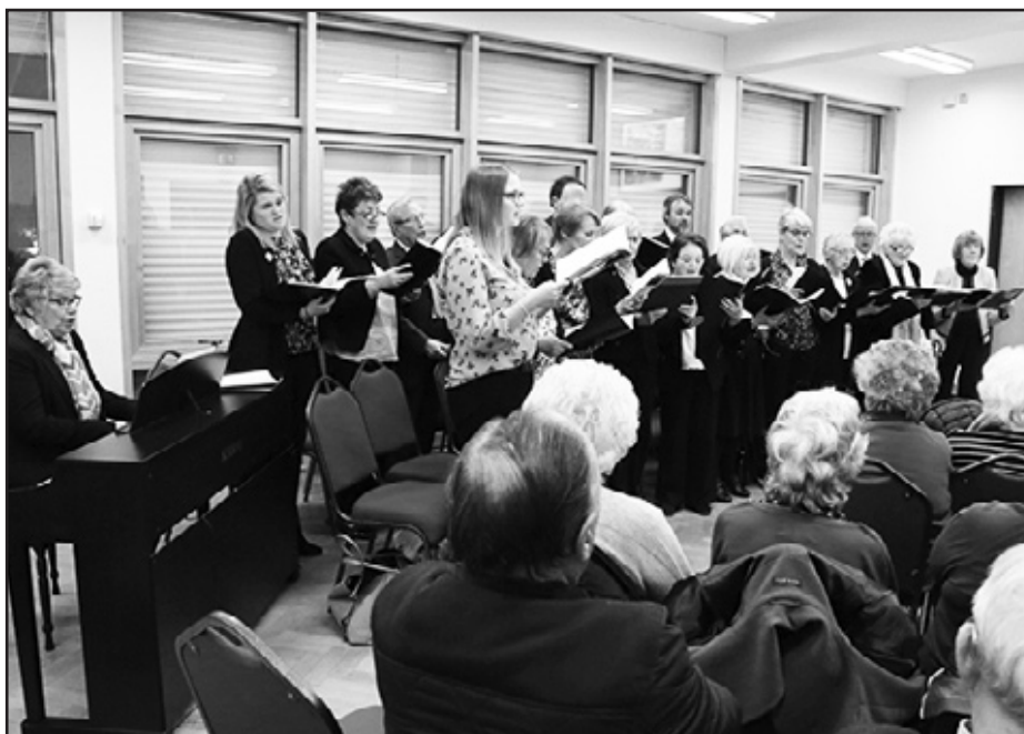
Myfyrddod ar y Pasg

gwasanaethu ar Sul y Pasg a daeth cynulleidfa gref ynghyd.