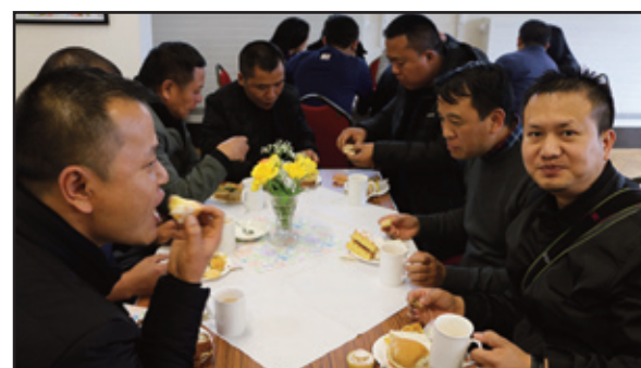
Y bechgyn yn mwynhau'r danteithion