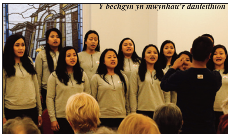
Y merched a'i lleisiau cyfoethog