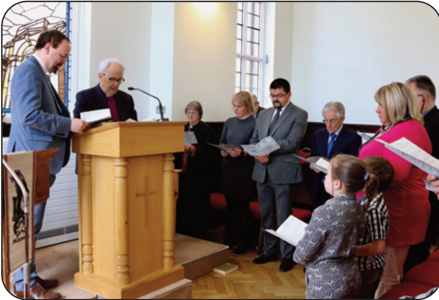
Seremoni'r Comisiynu ym Methel, Lerpwl