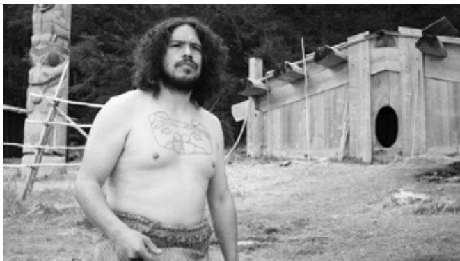
Dyn Haida o flaen tŷ traddodiadol

Gan fod y flwyddyn hon 2019 yn International Year of Indigenous Languages , da o beth yw ein bod ni yn tynnu sylw at yr ieithoedd sydd mewn gwir berygl. Onid ydym fel Cymry yn ffodus fod ein hiaith yn cael cefnogaeth dda gan y Cynulliad a gan y dysgwyr a Chymry cefnogol sydd yn prynu llyfrau, recordiau, cylchgronau, gwylio S4C ac yn ddarllenwyr brwd i bapurau bro, fel Yr Angor .