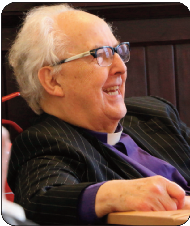
"Mae 'na un yn wastad ..."