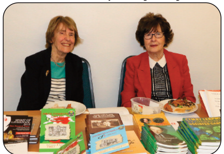
Gwarchodwyr y stondin lyfrau