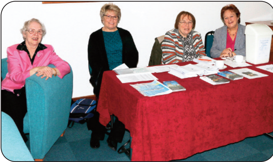
Y Tîm Croeso o Bethel