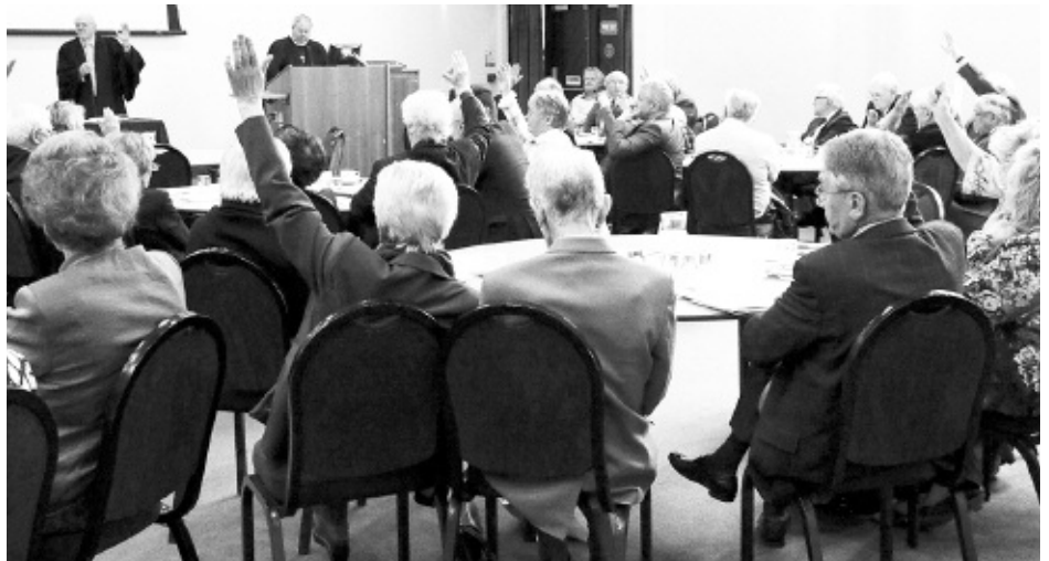
Y bleidlais ar genadwri o Lerpwl