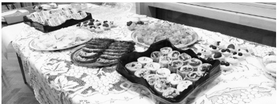
Bwyd wedi cyfarfod blynyddol yn y Ganolfan