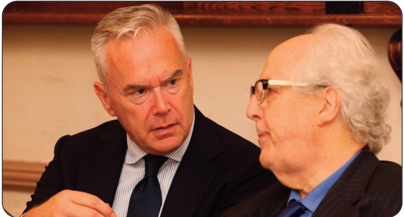
Y ddau ffrind yn trafod o ddifrif