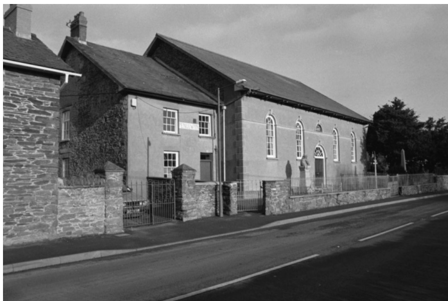
Capel Penllwyn ar fin y ffordd fawr rhwng Ponterwyd a Llanbadarn Fawr.

Chwaraeodd ran amlwg yn addysg grefyddol yr Eglwys. Am ddeg mlynedd ar hugain bu'n athro yr Ysgol Sul ac yn paratoi'n fanwl ar gyfer ei ddsbarth o oedolion. Edrychai ymlaen am yr esboniadau a baratoid, rhai gan weinidogion ei enwad ar y Glannau, ac eraill gan weinidogion ysgolheigaidd a ddeuai ar eu troi i Lerpwl i draethu'r gwirionedd yng Nghrist Iesu. Rhoddodd