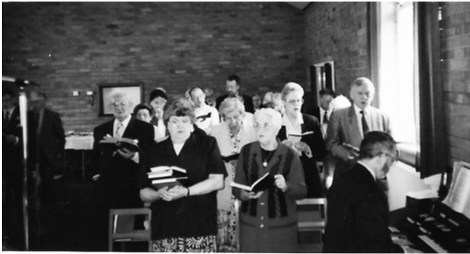
Capel Gas Street – Cau'r Capel 1998