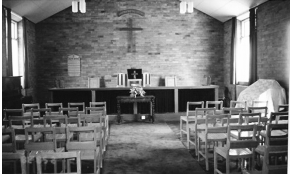
Capel Cymraeg Gas Street, Bolton

Roedd Deddf Priodas ( Marriage Act ) yn 1898 wedi dod i rym ac yn dweud bod gan Capeli Anghydfurfiol yr un hawl a oedd gan yr Eglwys Sefydledig, y Crynwyr a'r Iddewon, i gofrestru priodasau os oedd yna berson