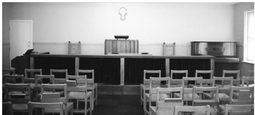
Capel Carmel, Caernarfon 1999

Ond mae cofio ymdrech, tystiolaeth a llawenydd y Cristnogion Cymraeg yn Manceinion a'r cyffiniau yn y y gorffennol yn rhoi hwb i ni, y gweddill ffyddlon, i'r dyfodol. Nid hanes trist mohono, ond rhythm naturiol, trefn gymdeithasegol a ninnau yn gorfod datblygu a chario ymlaen gan ofyn am ras i fod yn ufudd a ffyddlon i Dduw yn 2021. Gofynnwn hefyd fel teulu Duw sydd yn creu Hafan Gobaith i eraill y dyddiau hyn ac felly yn rhodd gogoniant i Dduw trwy ein bywydau a'n heglwysi.