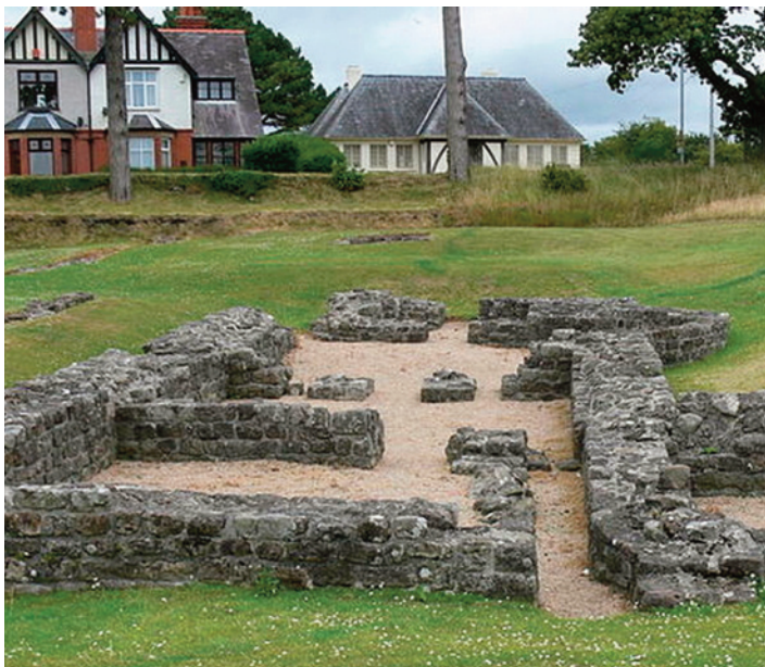
Adfeilion caer Rufeinig Segontium

Gwnaeth y Brenin Edward Gaernarfon yn ganolfan, yn wir yn brifddinas Gogledd-Orllewin Cymru. Heddiw mae'r dref yn ganolfan o hyd. Yno y mae pencadlys gweinyddiaeth llywodraeth leol ac mae'r dref a'r cylch yn ddiweddar wedi datblygu'n ganolfan teledu, gyda nifer o gwmnïau annibynnol yn creu rhaglenni amrywiol ar gyfer S4C. Dyma berl o dref hynafol lle mae y mwyafrif o'i thrigolion yn siarad y Gymraeg.