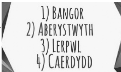
Canlyniad Eisteddfod Ryng-Golegol

Mae'n braff cael llongyfarch Cymdeithas Gymraeg Fyfyrrwyr Cymry Lerpwl am eu llwyddiant yn yr Eisteddfod Rhyng-golegol a gynhaliwyd ym Mhrifysgol Bangor ar ddechrau mis Mawrth. Dyma oedd y tro cyntaf i'r myfyrrwyr cymeryd rhan yn yr Eisteddfod ac maent wedi gwneud cryn argraff. Daethant yn drydydd y tu ôl i Brifysgolion Bangor ac Aberystwyth ond o flaen Prifysgol Caerdydd. Roeddynt yn medru ymarfer yng Nghanolfan Cymry Lerpwl - dyma'r fath o weithgaredd hoffem weld mwy ohono yn y Ganolfan. Nid oedd yn syndod i'r gohebydd bod y myfyrrwyr wedi llwyddo mor dda **!!! Rydym yn edrych ymlaen at glywed am eu llwyddiant yn yr Eisteddfod Ryng-Golegol y flwyddyn nesaf a gynhelir ym Mhrifysgol y Drindod Dewi Sant.