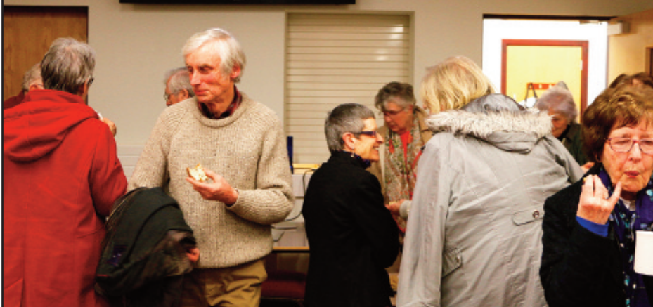
Ymunodd aelodau o Ddosbarth y Dysgwyr gyda selogion Cymdeithas Lenyddol Bethel.

Ariennir Yr Angor yn rhannol gan Lywodraeth Cymru