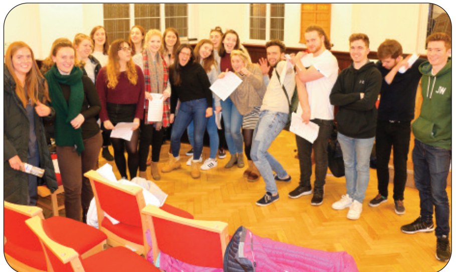
Myfyrwyr Prifysgolion Lerpwl yn barod i berfformio