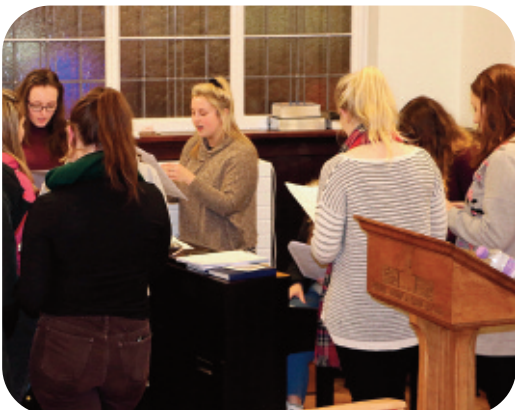
Ymarfer Côr y Myfyrwyr

Gweler tudalen 5 i gael yr hanes yn llawn.