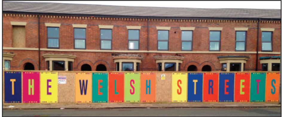
Y Welsh Streets

D a gweld y dasg o adnewyddu 35 o dai yn strydoedd Cymraeg Toxteth wedi cychwyn. Roedd cyngor Lerpwl a chymdeithas tai yn y lle cyntaf eisiau cael gwared a 271 o gartrefi yn y Strydoedd Cymreig ac adeiladau 154 o dai newydd. Mae'r cyngor yn gobeithio yn awr y bydd cyfran sylweddol o'r 300 o dai yn medru cael eu hadnewyddu, gyda rhai tai yn cael ei huno gyda eraill i'w gwneud yn fwy a fydd yn apelio at deuluoedd y dosbarth canol.