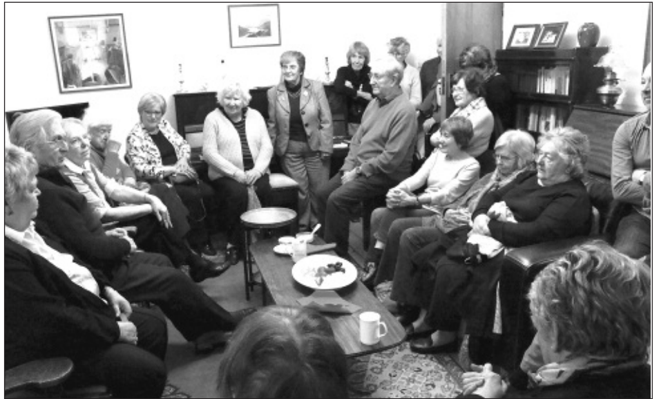
Noson Crempoga yn Awelon