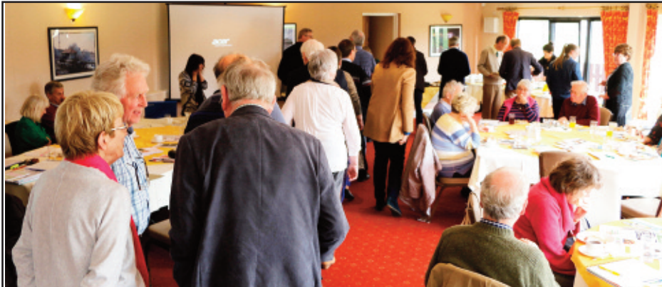
Cinio yn y Neuadd sydd yn edrych allan am bentref Llanbadarn Fawr