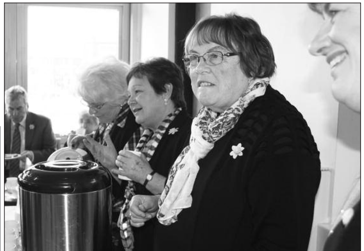
Y Chwirydd yn barod ar gyfer y lluniaeth