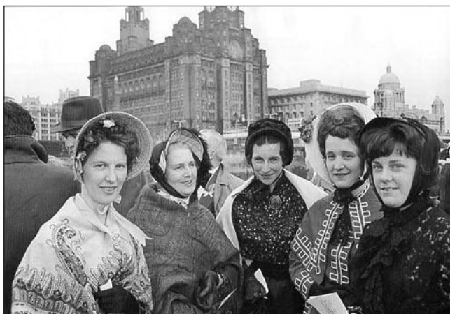
Aelodau o Aelwyd De Lerpwl (Heathfield Road) a wisgai ddillad cyfnod yr arloeswyr yn y dathlu.