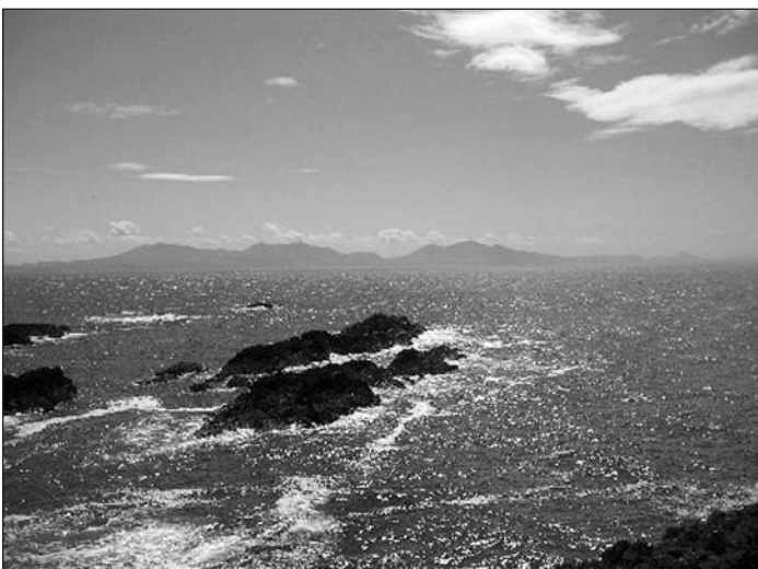
Enillydd y gystadleuaeth tynnu llun, y testun 'Glan y Môr'. (Bae Caernarfon, o Llanddwyn ar Ynys Môn)