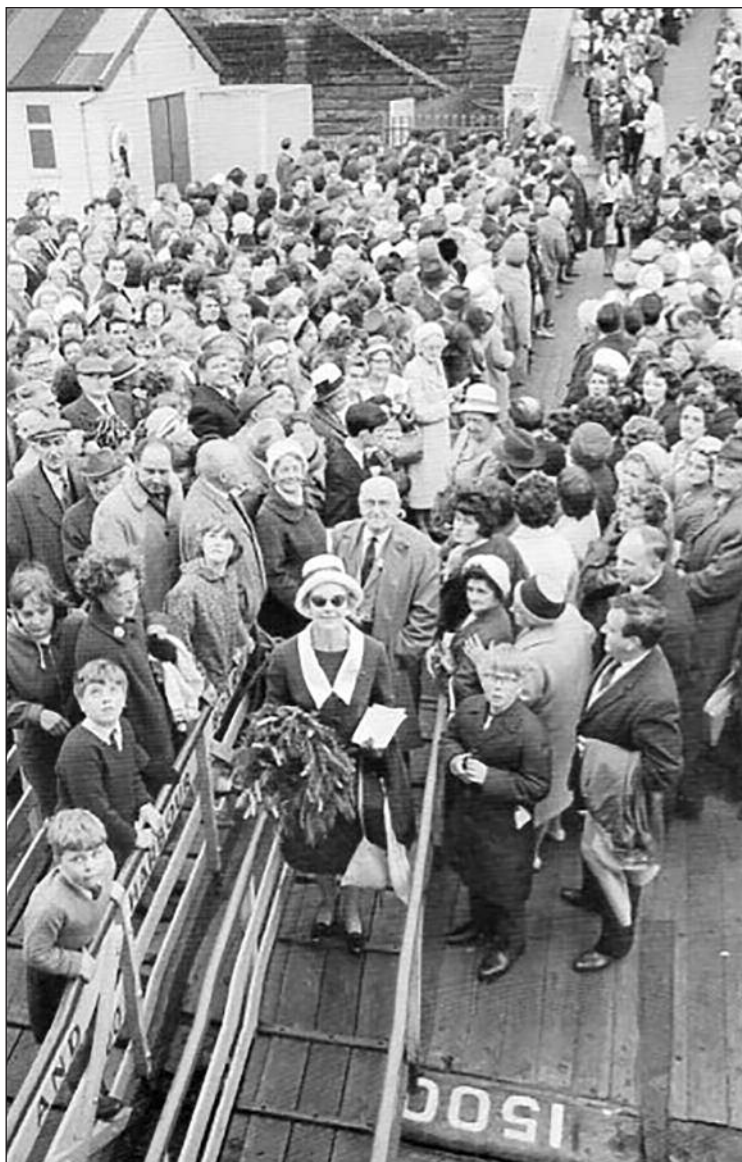
Plant ac oedolion yn 1965 yn dringo i'r llong.

Y gŵr a ofalai am y gwasanaeth crefyddol oedd y Parchedig Nefydd Hughes Cadfan, Llangynog ac un a anwyd yn y Wladfa. Yr oed ei dad a'i daid, Hugh Hughes, Cadfan o Lerpwl ar fwrdd y llong Mimosa yn 1865. Canwyd emynau Cymraeg ar fwrdd y Royal Daffodil o dan ofal Elfed Owen, Penbedw. Cafwyd 1,500 ar fwrdd y Royal Daffodil, edrychwn ninnau ymlaen am groesawu tyrfa gref yn niwedd Mai i ddadorchuddio'r Gofeb a fydd yn fwy parhaol na'r Royal Daffodil.