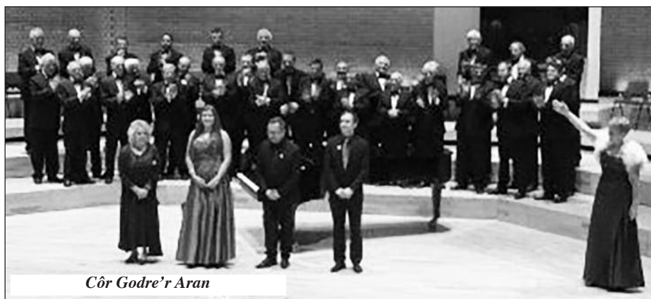
Chôr Godre'r Aran