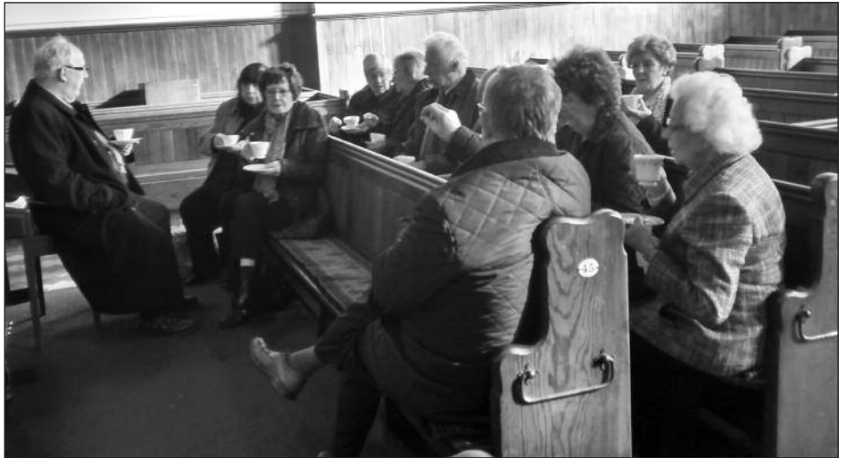
Cymdeithasu cyn ymadael