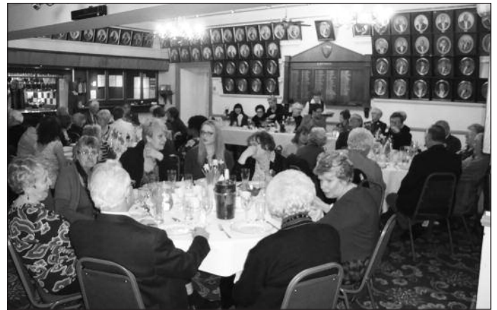
Yr Ystafell foethus