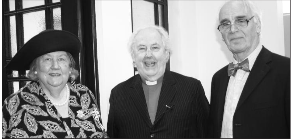
Lord Lieutenant, a'i phriod a'r Gweinidog yn y canol