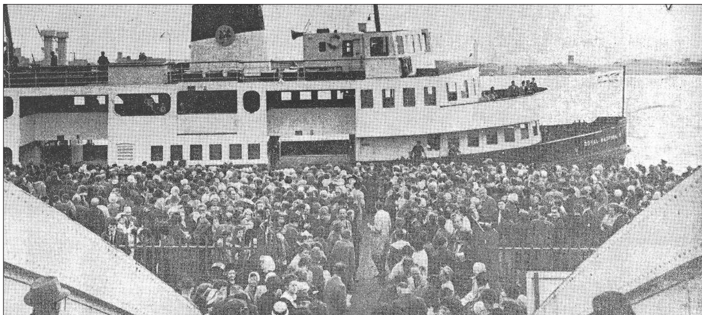
Y Royal Daffodil a'r dyrfa