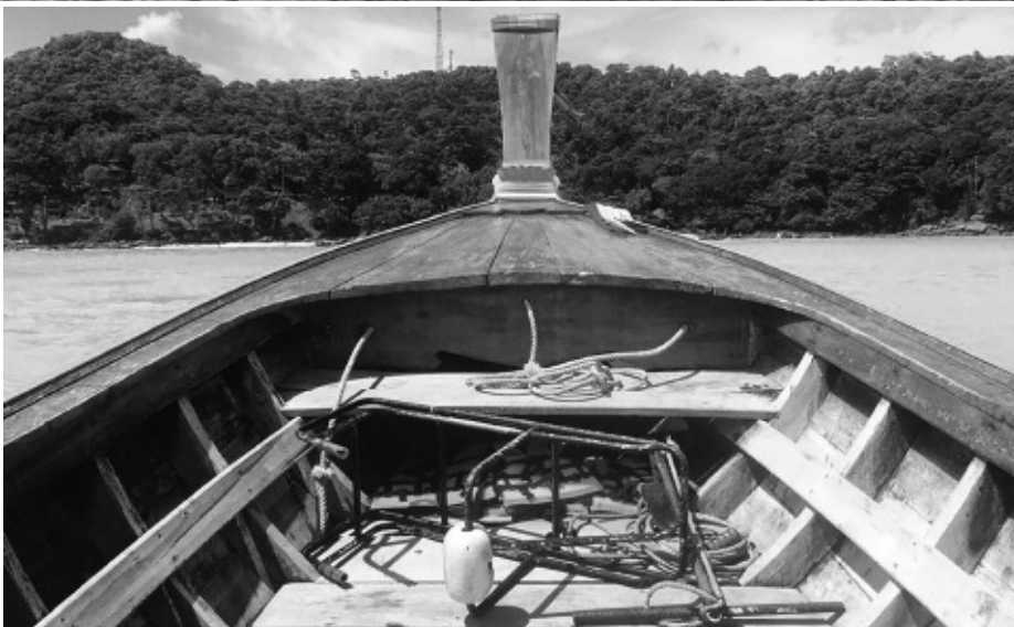
Cwch 'long tail' traddodiadol yn Thailand