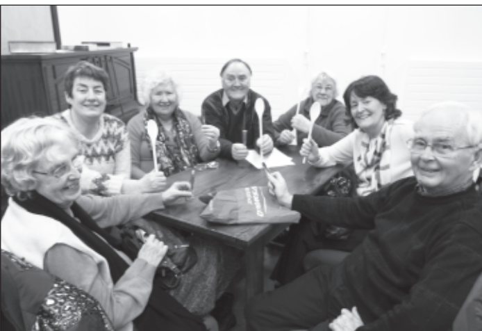
Hyfrydwch y llwyau pren