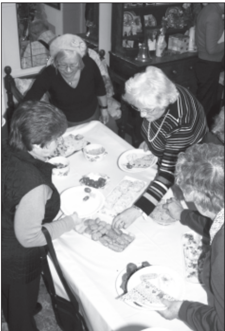
Ocsiwn fawr y Cymry

I ddechrau ail hanner y tymor fe gafwyd ocsiwn yn 5 Gwydrin Road.