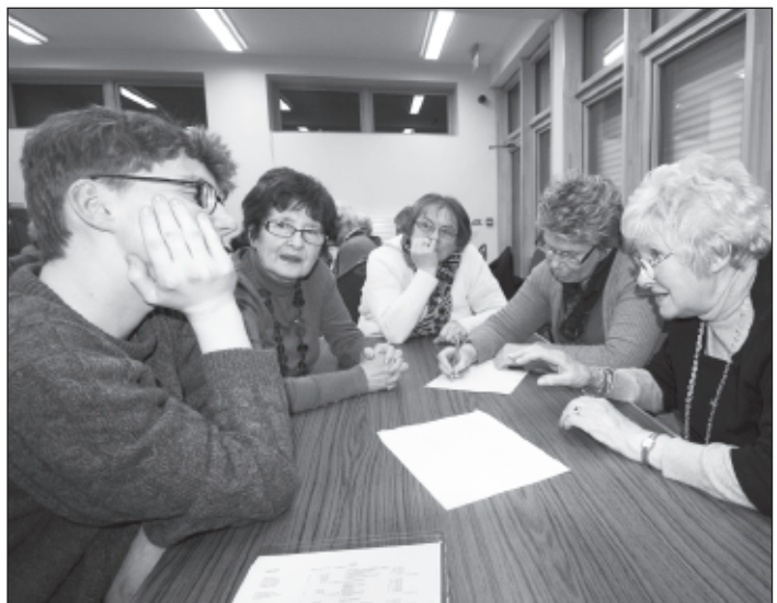
Tîm a wnaeth yn dda yn myfrio'n galed