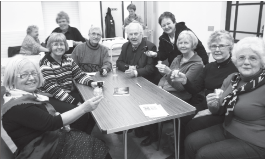
Llawenydd yr wyth oedd yn perthyn i'r tîm buddugol, Y Cogyddion

Cyflwynwyd gwobr i'r tîm oedd ar waelod y tabl, a chafodd y tîm hwnnw a alwai ei hunain yn Patagonia , bob un ei lwy bren, rhodd arall o garedigrwydd Devida.