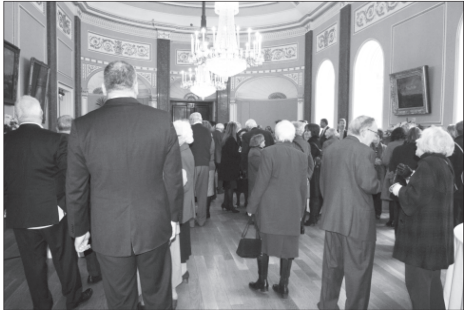
Gŵyl Dewi 2013

The room hire rate is based on a half day internal rate but for week day hire only, St David's day falls on a Saturday in 2014 we lose the capability to take a £3,390.00 external hire (wedding or dinner). And a 20% catering commission