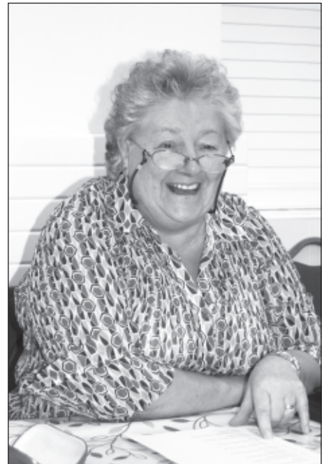
Devida wrth ei gwaith