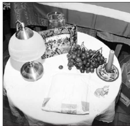
Gofal am y Cread