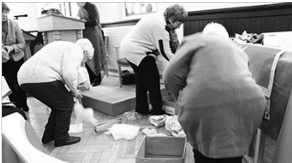
Hel ysbwriel – gorchwyl grefyddol arall