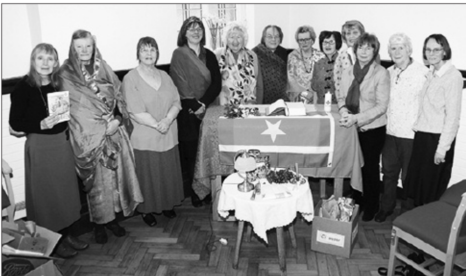
Cynrychiolwyr o Eglwysi Mossley Hill yn Bethel