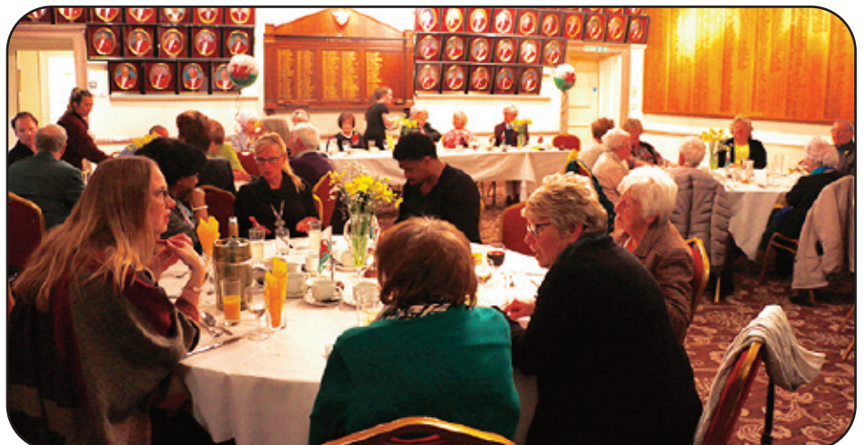
Golwg ar gefnogwyr Noson Gŵyl Ddewi

C. Gair am Air: Llan, Llawn, awn, llanw, llawnder, derw, erw, wad, adnod, nod, nodyn, dyn, dyna, yna, ynad, nad, aden, enw