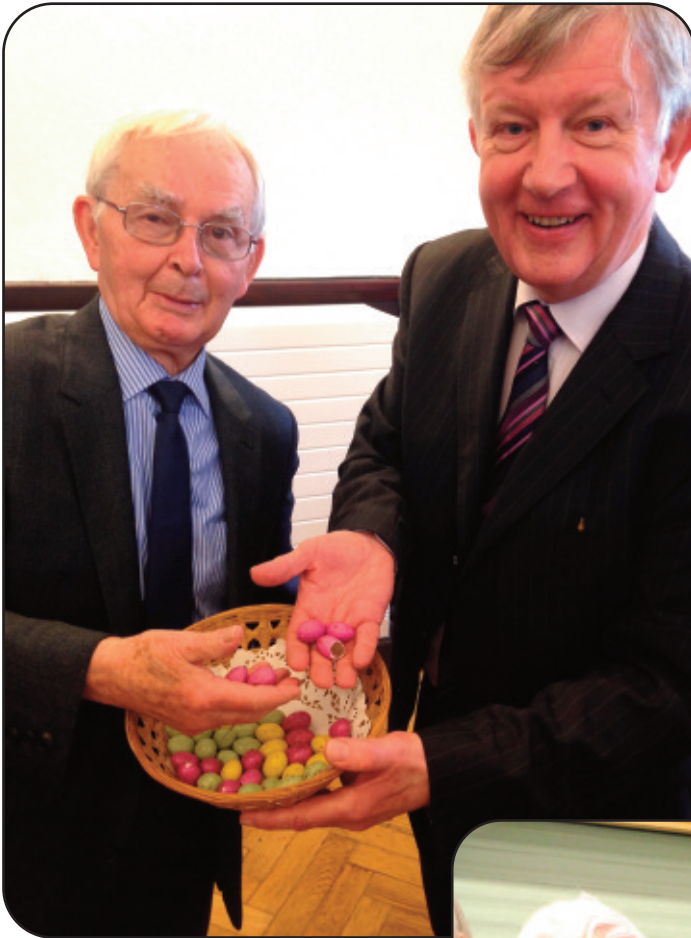
Rhannu wyau'r Pasg wedi'r oedfa bore Sul y Pasg

Dathlwyd y Pasg ymhlith Cymry'r Glannau a Manceinion