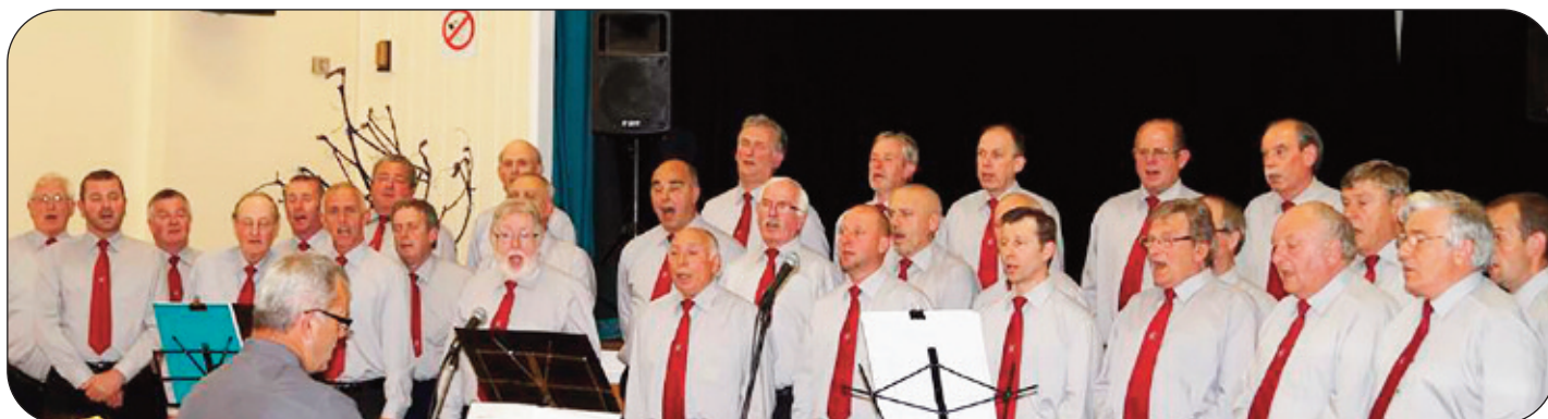
Côr y Porthmyn, Dyffryn Clwyd a ddaw i Lerpwl i gynnal y Cyngerdd ar Fehefin 11 (gweler yr hanes ar dudalen 2)