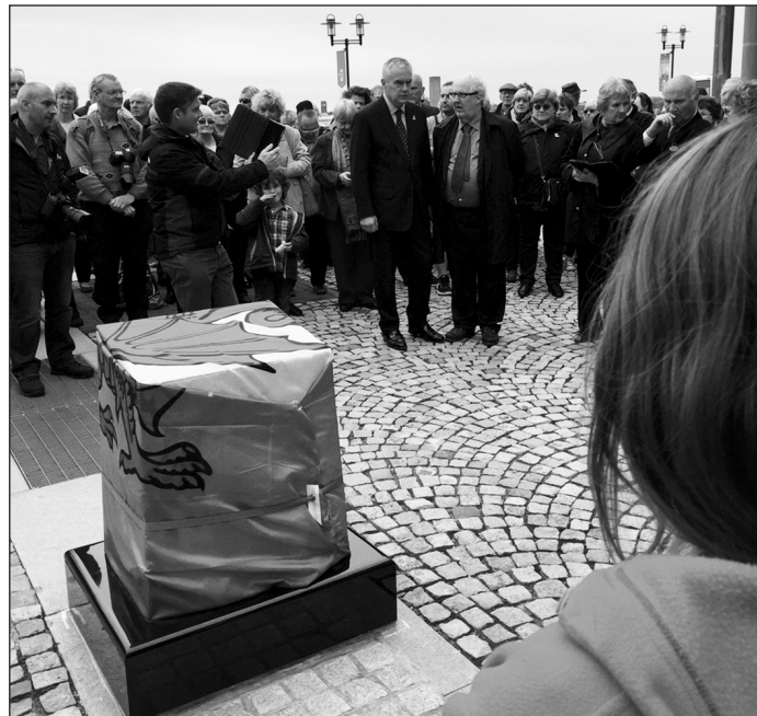
O flaen y Gofeb hardd