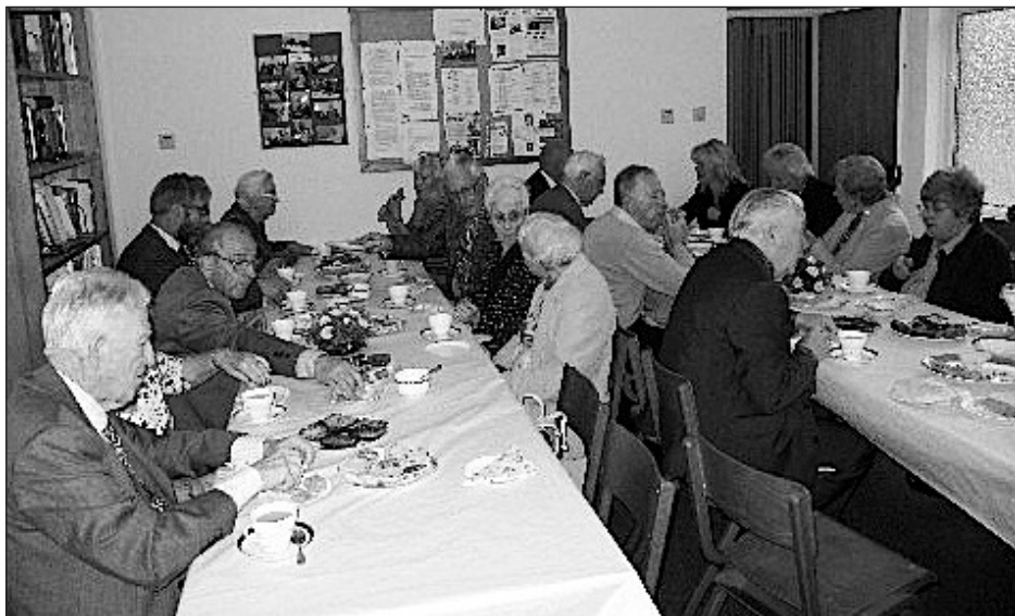
Mwynhau y te blasus!

Defnyddiwyd rhan helaeth o'r emynau yn Rhaglen Cymanfaoedd Canu 2015, ac er ein bod yn gynulleidfa fechan, cawsom ganu pedwar llais brwdfrydig o dan law ein harweinyddes medrus. Hawdd gweld fod y rihysals a gawsom dros misoedd y gaeaf wedi bod o fudd, a diolchwn i'r arweinyddion lleol am eu llafur. Cafwyd te