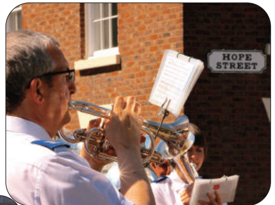
Y Stryd a'r offerynnwyr yn cyhoeddi Gobaith

Mae'r Nadolig yn Wyl y Teulu, Pasg yn Wyl y Fuddugoliaeth, a'r Pentecost yn Wyl geni'r Eglwys. A ddylem ei galw yn Wyl y Llawenydd?