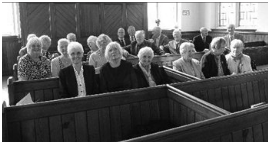
Rhai o'r cantorion yn cael seibiant.

frwd ac erioed. Hir y parhaed felly. Yn dilyn, cawsom ddatganiad bendigedig ar yr organ gan ein harweinyddes.