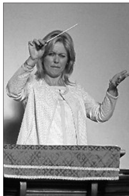
Yr arweinyddes wrth ei gwaith