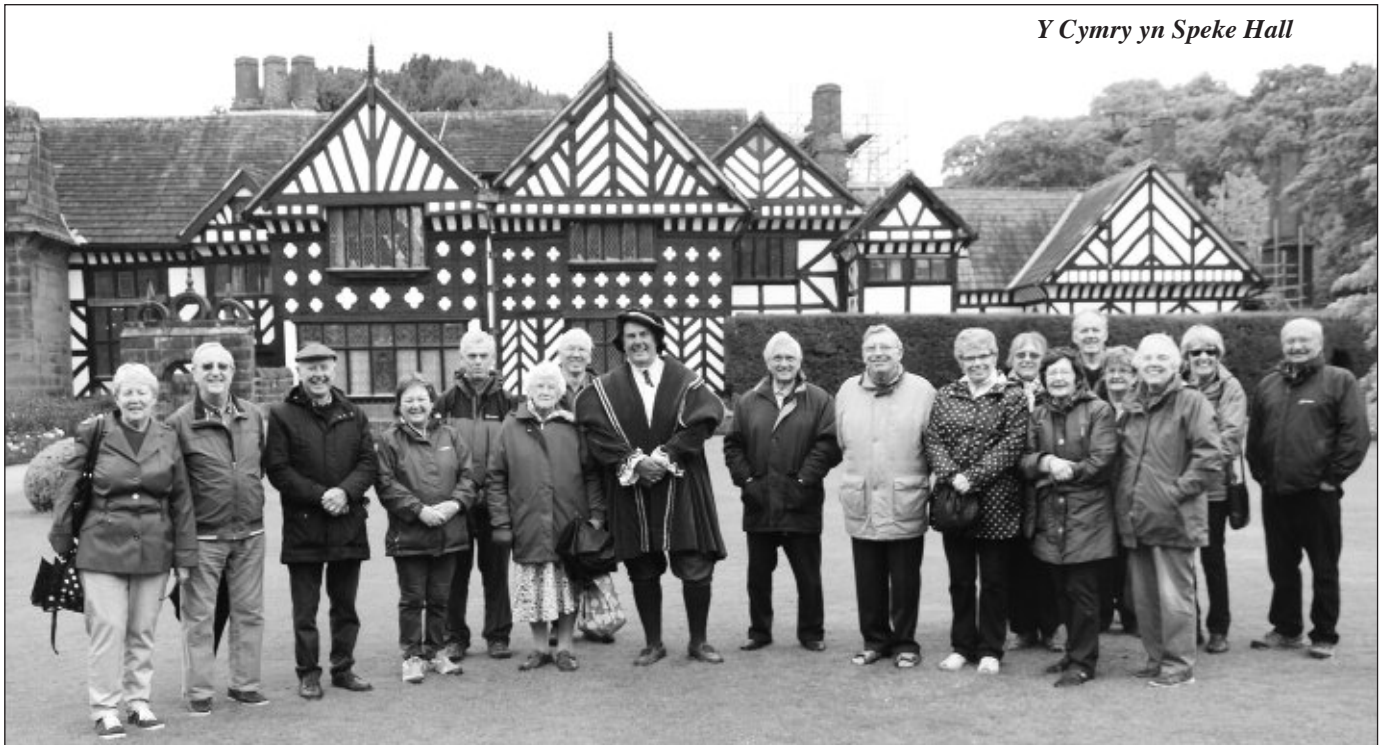
Y Cymry yn Speke Hall