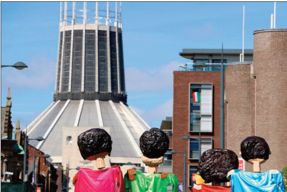
Llun o'i gamera