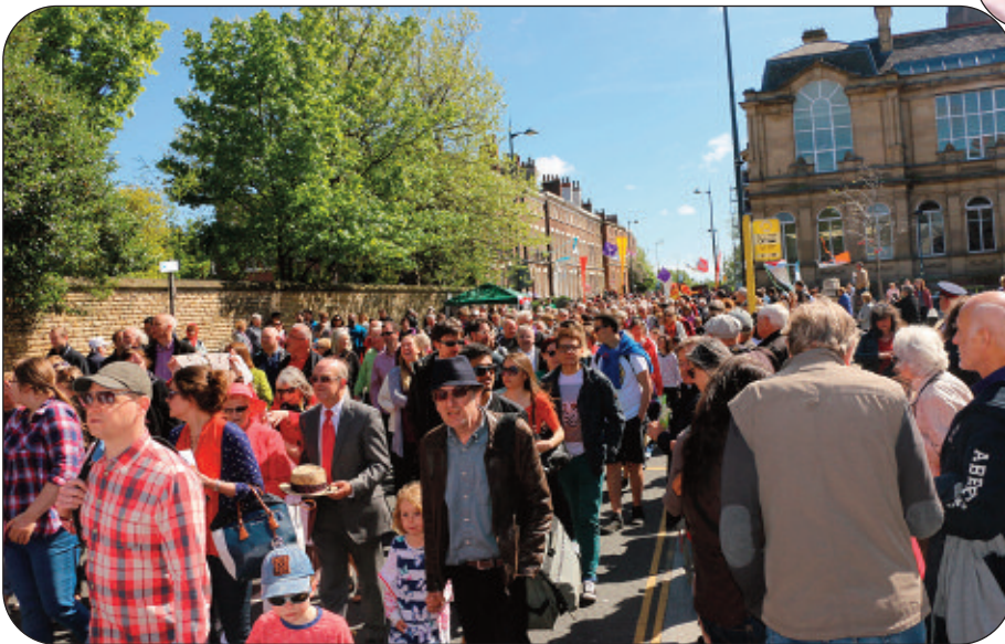
Croesdoriad o'r pererinion