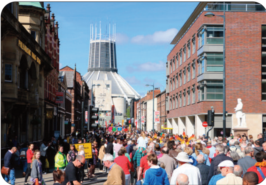
Cristnogion o bob lliw ac iaith yn Hope Street