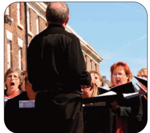
Moliated y Cenhedloedd

Gwelwyd Undeb Gorawl Cymry Lerpwl yn cyfrannu yn gofiadwy