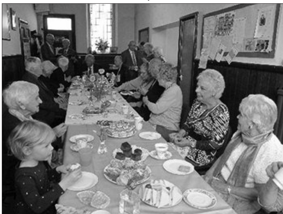
Mwynhau y te blasus