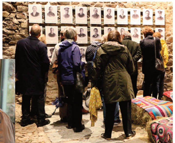
Lluniau y milwyr a gollodd ei bywydau