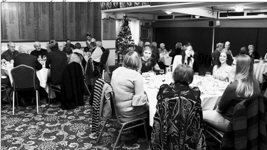
Cinio Nadolig Cymdeithas Cymry Lerpwl

Defnyddiwyd y llong i gario llythyrau rhwng Kingstown a Chaerdybi. Yn ystod y Rhyfel Byd Gyntaf roedd llongau tanfor yr Almaen (U Boats) yn hwylio ym Môr yr Iwerydd ac ar hyd arfordir Cymru. Erbyn hyn 'roedd y llong wedi ei phaentio mewn cuddliwiau. Ar ddiwrnod y llongdrylliad roedd 70 o griw ar y llong, 35 o Gaerdybi a 35 o Iwerddon. 'Roedd 22 o ddynion yn sortio llythyrau ar y siwrne o Kingstown i Gaerdybi ac roedd 490 o filwyr yn hwylio ar y llong hefyd. Gadawodd 'Leinster' Kingstown am 9.10am a dylai fod wedi cyrraedd Caerdybi erbyn amser cinio. Taniwyd tri torpeddo gan U-boat yn ymyl y goleulog Kish tu allan i Fae Dulyn a suddodd y Leinster yn gyflym. Hwn oedd y trychineb gwaethaf ym Môr yr Iwerydd. Bu farw tua 596 o bobl. Nid oedd y 'Leinster' yn cario arfau na nwyddau.