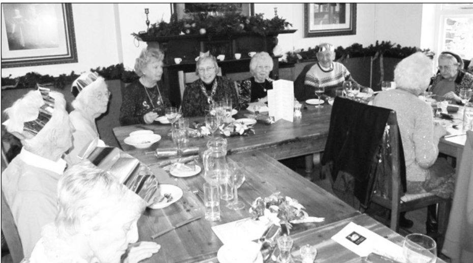
Cyfeillion Altrincham a Noddfa Oaker Avenue yn mwynhau cinio Nadolig yn y 'Swan with Two Nicks' yn Dunham Massey.