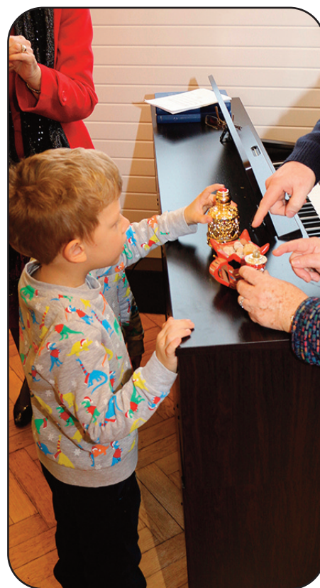
Joshua yn edrych ar Thus a Myrr yn oedfa Bore Nadolig