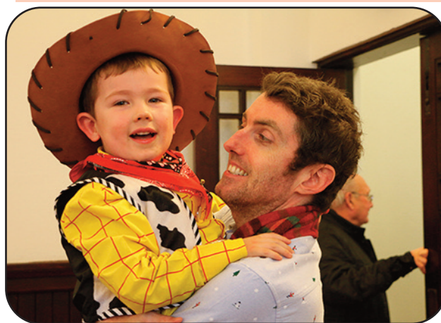
Harri ac Yncl Alun