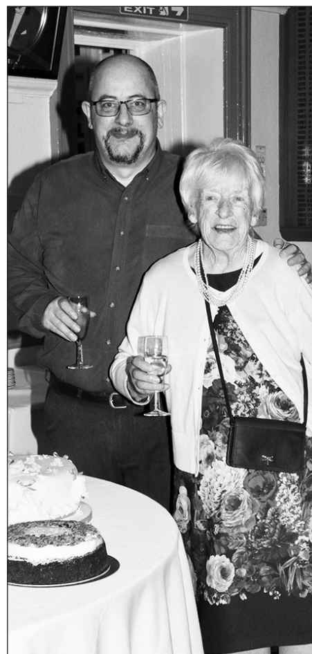
Alun a'i fam