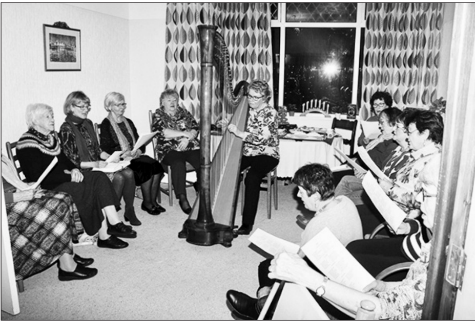
Cymdeithas Cymry Lerpwl yn nhŷ Margaret

Cafodd y drychineb effaith mawr ar drigolion Caergybi ac ar gwmi perchnogion y llong. Ni chynhaliwyd ymholiad swyddogol i'r achlysur. Bu llawer o sŏn yn y wasg fod yn rhaid dial ar yr Almaen ac wedi'r cadoediad ychydig o amser wedyn fe gollodd yr Almaen lawer o dir ac arian ac oherwydd hyn fe heuwyd gwreiddiau yr Ail Ryfel Byd. Mae llongdryiliad y 'Leinster' wedi dylanwadu ar hanes Ewrop a'r byd yn yr ugeinfed ganrif - dyma'r llong a newidiodd y byd.