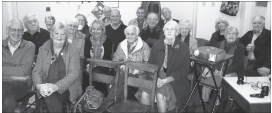
Criw yn disgwyl y darlithydd