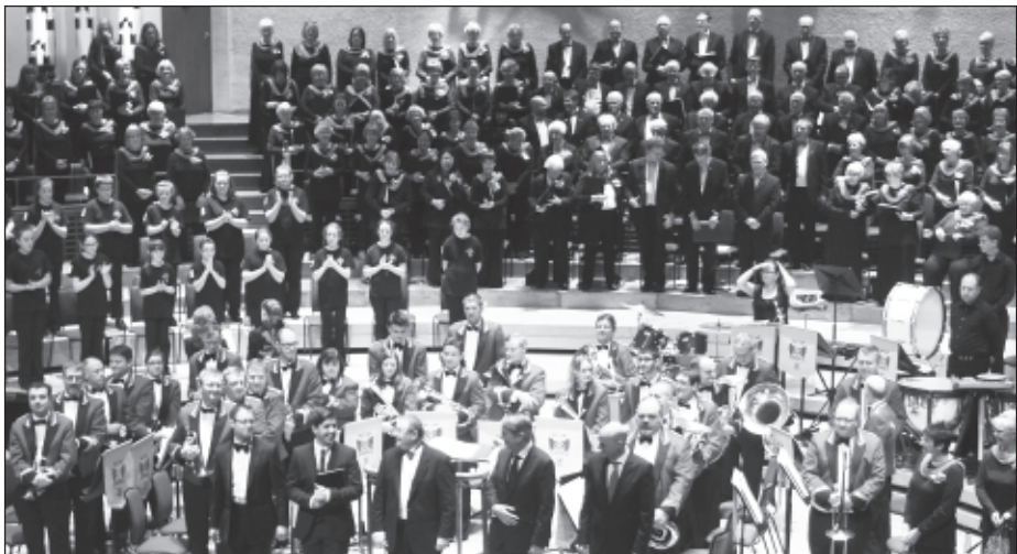
Pnawn Sul yn y Philharmonic