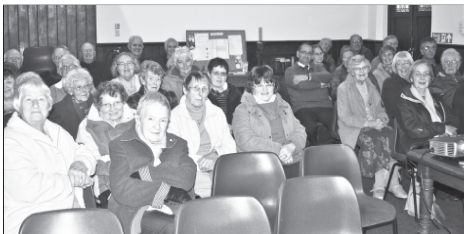
Cymdeithas Cymry Birkenhead