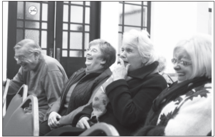
Y Gymdeithas Lenyddol yn mwynhau hiwmor Nan

derbyn, y cwmni a'r gwledda. Clywsom am bentref Woolton wedi ei addurno gan ŵr o'r enw Ged Comerford a'i gyfeillion, a chlywsom amdanant hefyd ar y teledu, wedi cael eu dewis i addurno coeden Nadolig Bethlehem – "A North West team chosen to decorate the most famous tree in the world: the boys from Wavertree taking the baubles to Bethlehem." 'Roeddynt hefyd yn addurno Camp Bastion yn