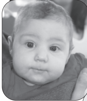
Willow (merch Ffion)