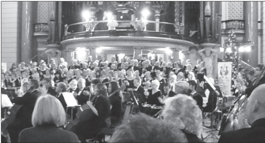
Cyngerdd yn Neuadd San Siôr

Bu y Côr yn brysur iawn trwy dymor yr Adfent. Cynhaliwyd tri chyngerdd ganddynt: un yng Nghilgwri, y llall ar gais Dinas Lerpwl yn Neuadd Sant Siôr a'r olaf yn Neuadd y Philharmonic, Lerpwl a'r tŷ yn llawn. Bu canmol ar y canu a'r holl gyflenwad cerddorol, a gwnaeth Gordon Burns ei waith yn dda yn absenoldeb Huw Edwards yr oedd disgwyl mawr amdano.