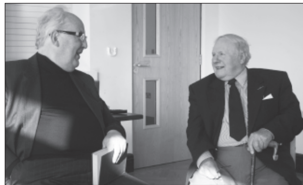
Dau gyhoeddwr yn sgwrsio