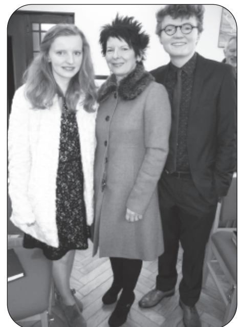
Nia a'i theulu o Llanddoget