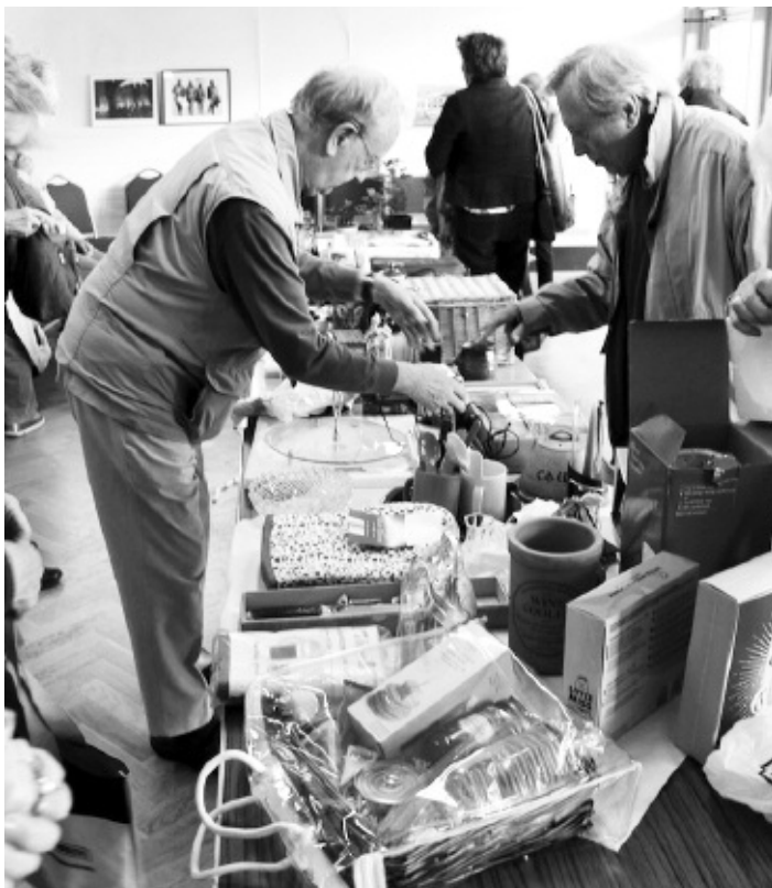
Noson yr Ocsiwn a ddaeth ag elw da i Corwynt Cariad