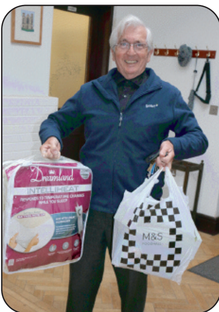
Trysorydd Yr Angor yn drwmlythog ar ddiwedd yr Ocsiwn