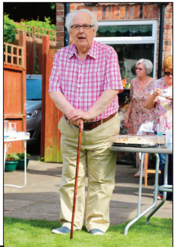
Y Golygydd Weinidog ar hen ffon ei famgu