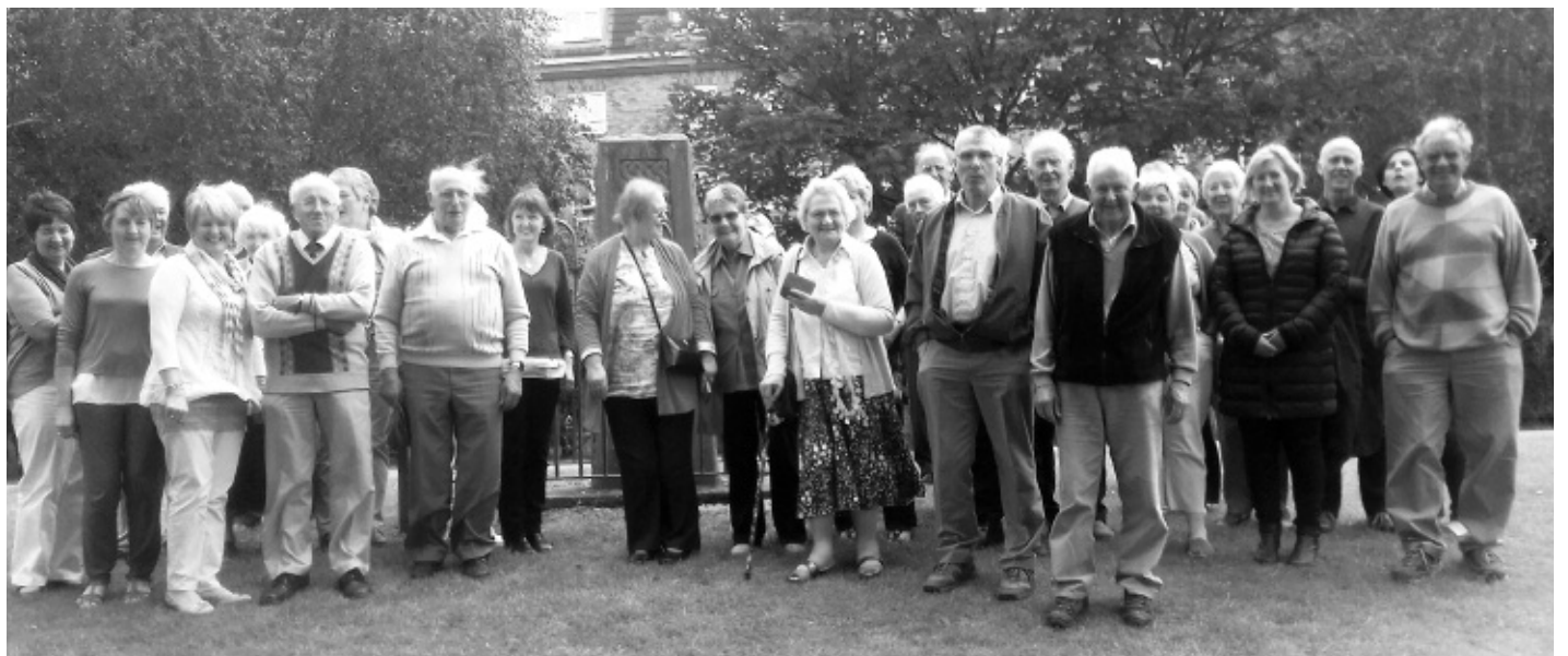
Aelodau capeli ardal Betws Gwerful Goch yn ymweld y garreg sy'n nodi Eisteddfod y Gadair Ddu Penbedw 1917