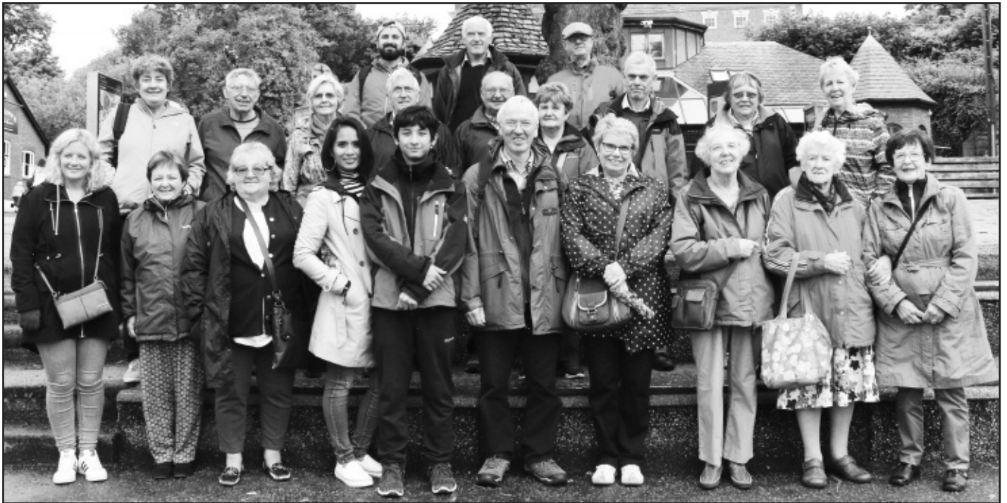
Cofleidio'r adar a'r criw a fu ar y daith i Gaer