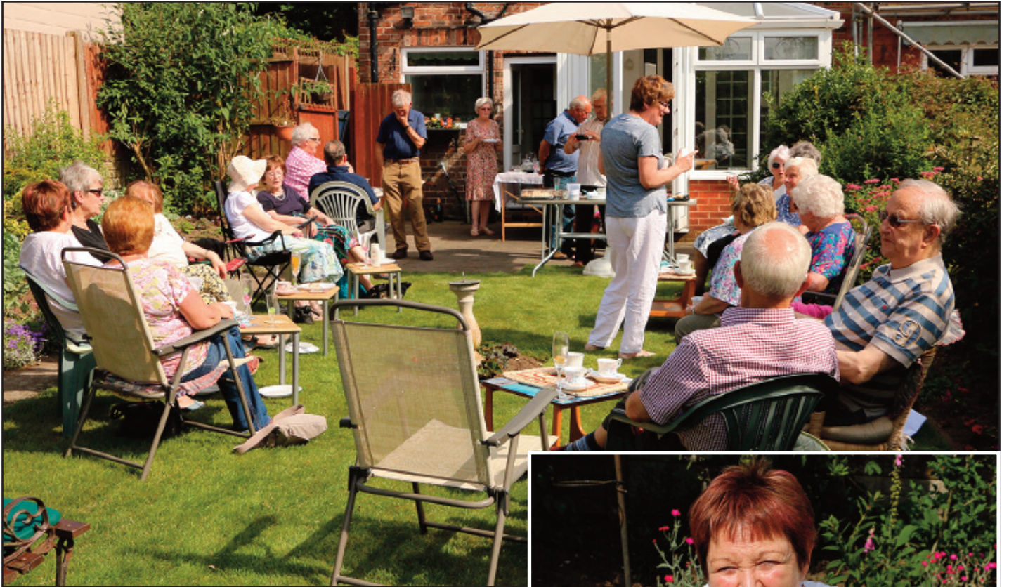
Ymlacio yn yr heulwen a sgwrsio braf yn yr ardd hardd