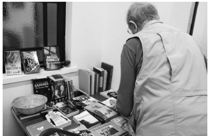
Stondin y llyfrau a'r recordiau