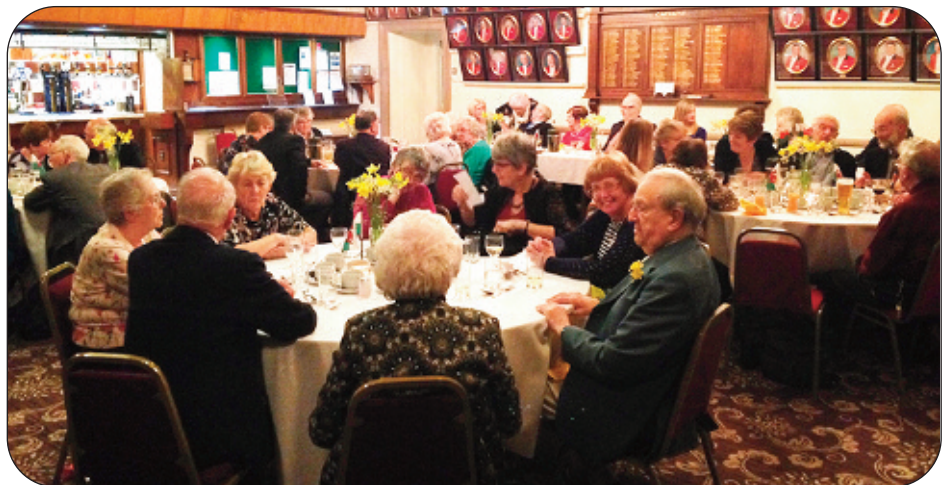
Yr ystafell yn llawn o Gymry brwd

YN Y RHIFYN HWN: Noson Gwylwyr S4C yn Lerpwl. Newyddion Seion, Penbedw; Bethania, Bethel, Cymry Lerpwl, Cymru Manceinion; Cronfa Arbennig; Adolygiad Cyfrol Werthfawr; Cystadleuaeth