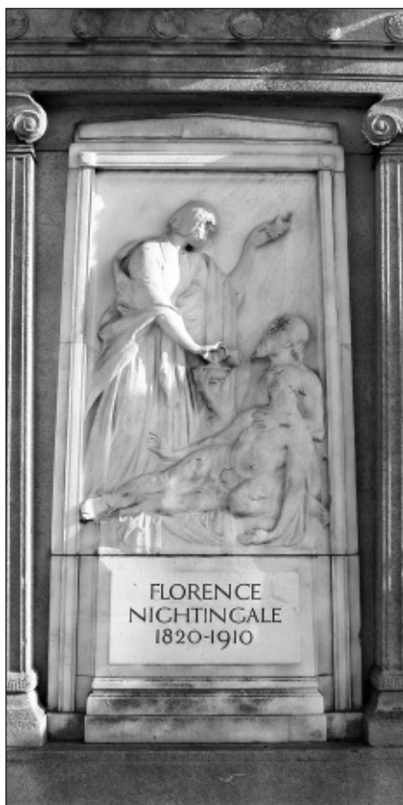
Cofeb Florence Nightingale

1825 wedyn daeth y lle yn fynwent ac yna y claddwyd llawer iawn o enwogion Lerpwl, e.e. Kitty Wilkinson a William Huskisson. Clywsom sôn am y Gadeirlan Anglicanaidd a gynlluniwyd gan Giles Gilbert Scott. Troi yn ôl wedyn ar hyd stryd Catharine lle mae cerflun o'r Swper Olaf uwchben drws Eglwys St Phillip