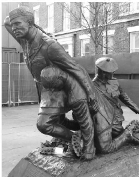
Cofeb Noel Chavasse

Shepherd a Derek Worlock. Ymlaen i Sgwar Abercromby lle mae cerflun i Noel Godfrey Chavasse a anrhydeddwyd am ei ddwerder yn y Rhyfel Byd Cyntaf pan gafodd un Military Cross a dwy Victoria Cross. Aethom wedyn i erddi St James o dan y Gadeirlan. Chwarel oedd yna hyd